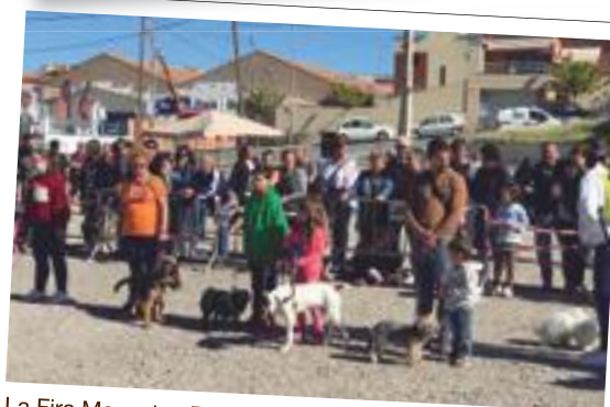
La Fira Mascotes Borges 2018 va fer gaudir els amics dels animals