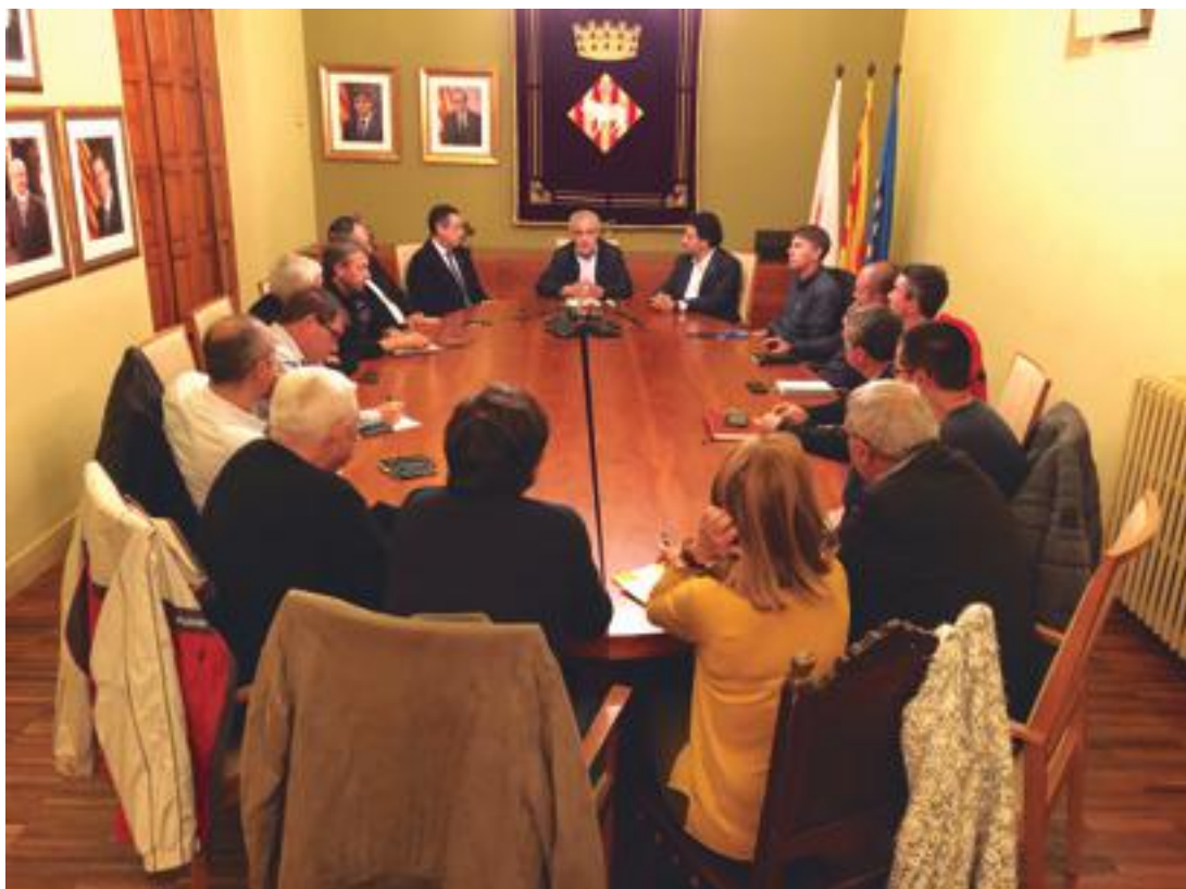
■ La reunió de la Plataforma Prou Morts a l'N-240 amb el Secretari d'Infraestructures i Mobilitat, Isidre Gavín

El secretari d'Infraestructures i Mobilitat també va anunciar que a partir d'aquella setmana els vehicles pesants ja podrien accedir als desviaments en el mateix sentit de la marxa per a la càrrega i la descàrrega, una de les reivindicacions dels transportistes. A més a més, Gavín va assegurar que la solució definitiva a la problemàtica de l'N-240 és la vinyeta catalana i que la Generalitat ja està treballant en la creació un grup de treball perquè sigui possible a pocs anys vista. ■