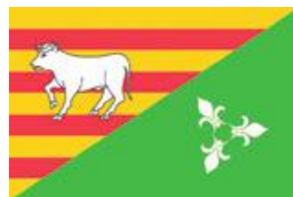
■ Proposta Bandera 3