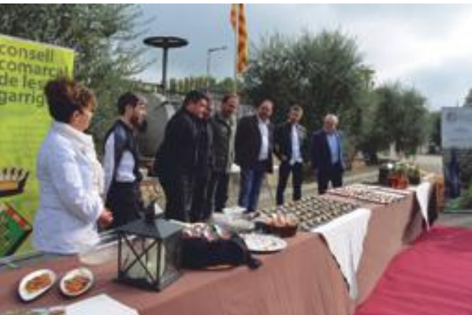
■ 24a Mostra Gastronòmica de les Garrigues

Durant els darrers mesos, el Consell Comarcal de les Garrigues ha donat un impuls a la promoció econòmica de la comarca amb el suport a la creació de vuit projectes empresarials vinculats a la cadena de valor de l'oli .