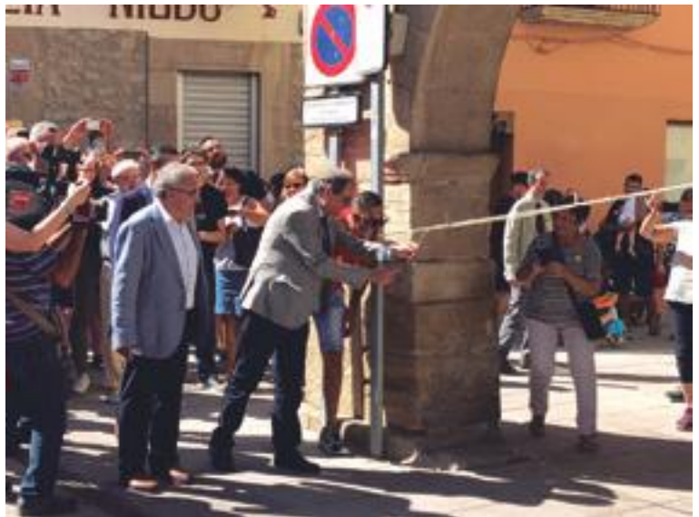
■ El president Torra encén la traca d'inici de la Festa Major 2018 de les Borges Blanques

La música va guarnir les nits de la Festa Major amb actuacions de la Tieta Clara, Bandarra Street Orkestra, Koers, entre altres.