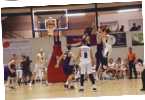
Gran expectació al torneig de bàsquet ciutat de les Borges Blanques 2018

Butlletí d'informació municipal Desembre 2018 | Num. 21