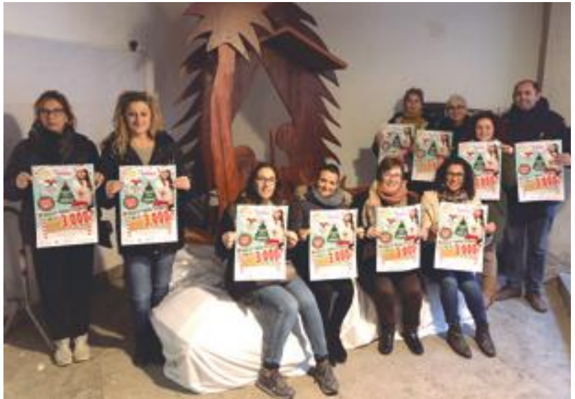
■ El regidor de Promoció Econòmica i les representants de l'Agrupació de Comerciants de les Borges presentant la campanya de Nadal 2018

A més a més, l'organització ha programat també dos sortejos extraordinaris de 200 euros els dies 24 i 31 de desembre. I, amb l'arribada dels Reis, el dia 5 de gener, un tercer i últim sorteig d'un val de compra valorat en 300 euros.