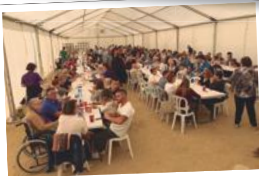
La fideuada solidària d'aquest octubre