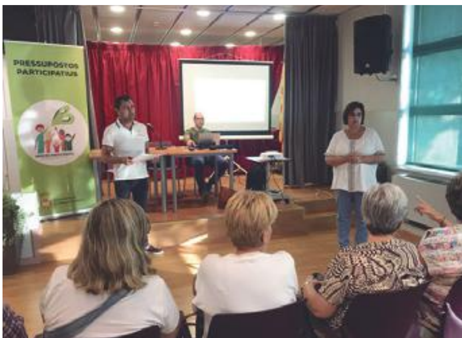
■ Jornada de divulgació dels pressupostos participatius de les Borges.

A més a més, en la fase final de votació hi han participat un total de 508 persones, una xifra que suposa el 9,92% de la població majors de 16 anys.