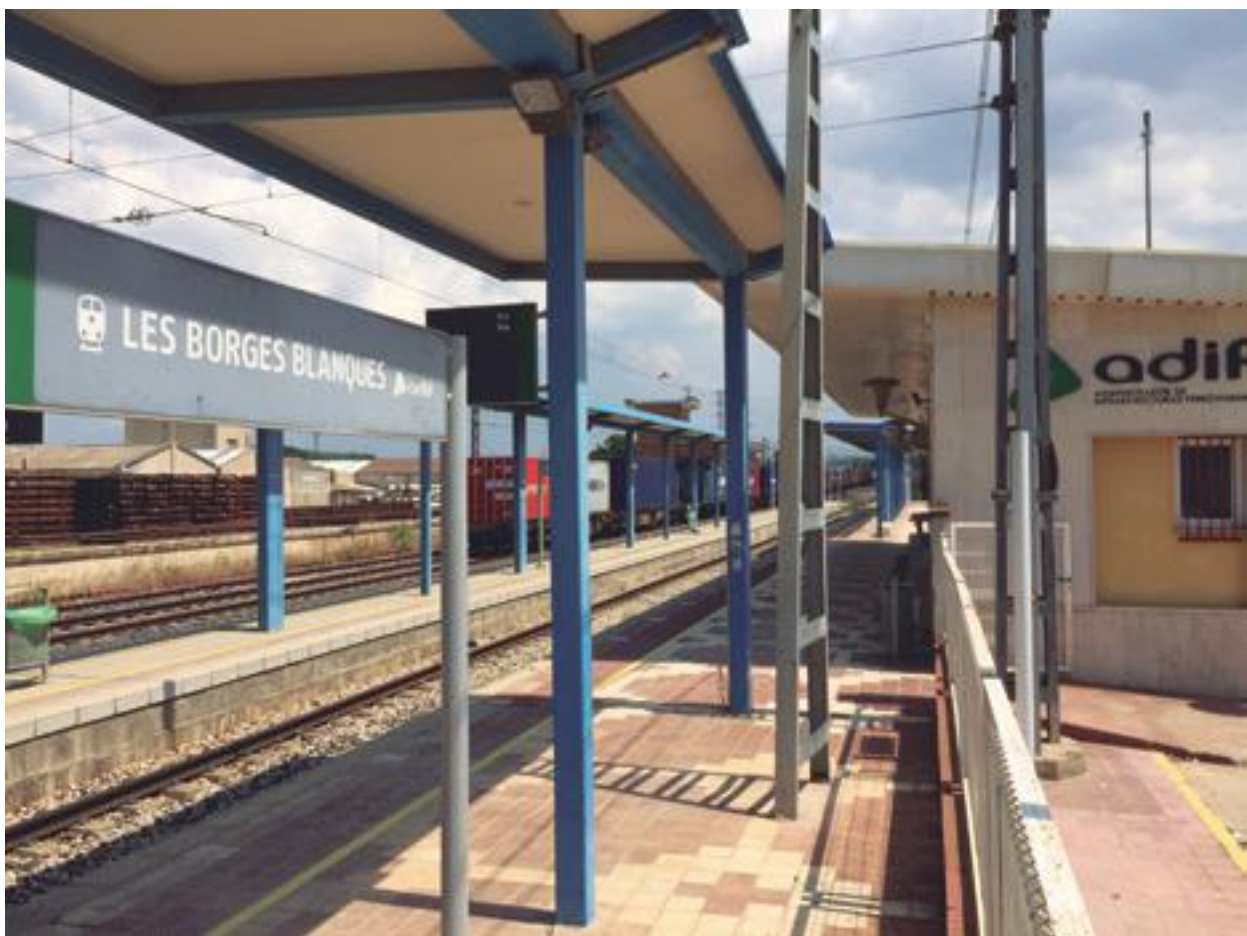
■ L'estació de ferrocarril de les Borges Blanques

La moció insistia en què l'Ajuntament de les Borges Blanques considera que cal corregir aquesta situació i que els trens, tornin a fer parada a l'andana de la Via 2, que és la que presenta un accés directe des de l'Estació. Aquest acord del Ple va ser comunicat a l'Administrador d'Infraestructures Ferroviàries, al Síndic de Greuges i al Departament. ■