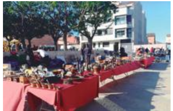
■ El mercat d'antiquaris, brocanTERS i col·leccionistes de les Borges Blanques

L'Ajuntament de les Borges Blanques va organitzar dilluns 10 de desembre una xerrada al Casal Cívic al voltant de la recollida selectiva i dels objectius en la gestió de residus que ha marcat la Unió Europea per al 2020 i que estableixen un augment del reciclatge de fins al 50%. Es tracta de la segona xerrada sobre el reciclatge que té lloc a la capital de les Garrigues - la primera es va celebrar el passat 12 de novembre - i que pretén conscienciar la població dels beneficis que comporta la separació de residus per al medi ambient. ■