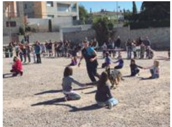
■ L'espectacle d'agility humà va encandilar petits i grans.

Per la seva banda, la 6a edició de la Fira de Mascotes va emocionar petits i grans a l'era del Rabasser de la capital garriguenca amb les demostracions i els espectacles protagonitzats per cans.