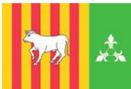
■ Proposta Bandera 2, l'escollida