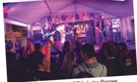
El concert estrella de la V FIRRA de les Borges