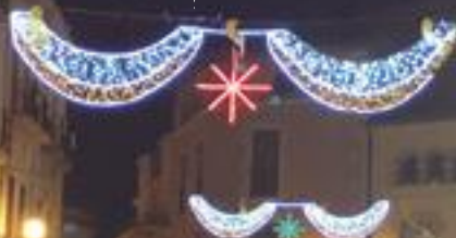
Enric Mir Pifarré Alcalde de les Borges

"En nom de l'Ajuntament, m'agradaria desitjar-vos unes bones Festes de Nadal i un 2019 ple de pau, salut i prosperitat a tots i totes"