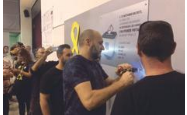
■ La instal·lació de la Placa en record del referèndum de l'1 d'octubre al Pavelló de l'Oli de les Borges

En compliment del que disposa l'article 133 de la Llei 39/2015 d'1 d'octubre de 2015, de Procediment administratiu comú de les Administracions Públiques, la nova ordenança servirà per regular unes normes de conducta pel que fa al comportament a la via pública i als espais públics, així com un règim d'infraccions i sancions per fets o conductes que suposin l'incompliment de les obligacions o prohibicions establertes en la pròpia ordenança municipal. ■