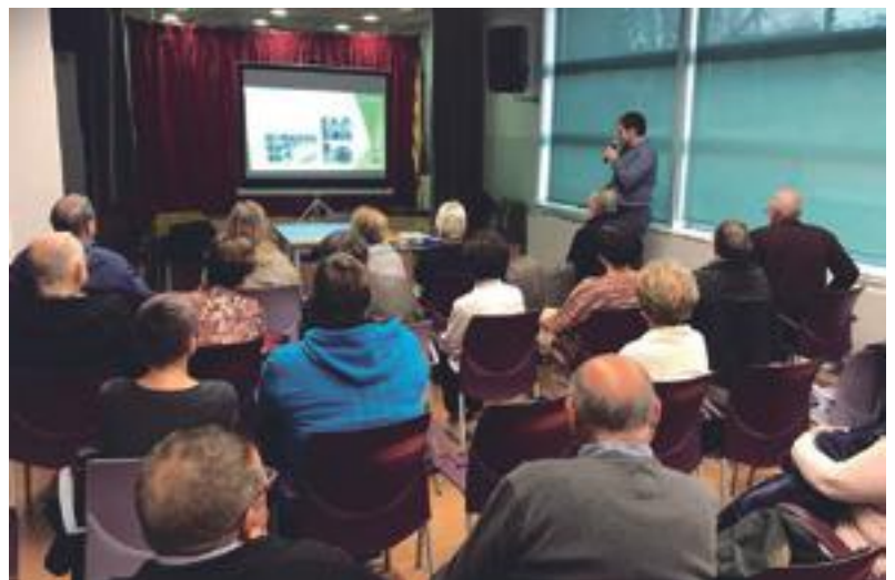
■ La xerrada per a promoure el reciclatge a les Borges