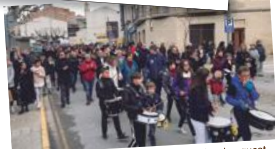
La festa del pubillatge de les Borges celebrada aquest novembre