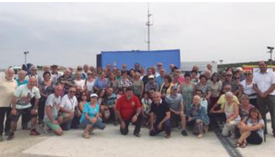
■ Foto de grup de la I Trobada d'autocaravanes a les Borges

El Centre d'Empreses Innovadores de les Borges incorpora a les seves instal·lacions Lleida Assistencial, una empresa dedicada a la cura i l'atenció sociosanitària de persones malaltes i amb discapacitats físiques i psíquiques. Amb la nova incorporació, el CEI de les Borges dona servei a 6 empreses i frega el complet, ja que només queda lliure un espai per al qual ja hi ha persones interessades. ■