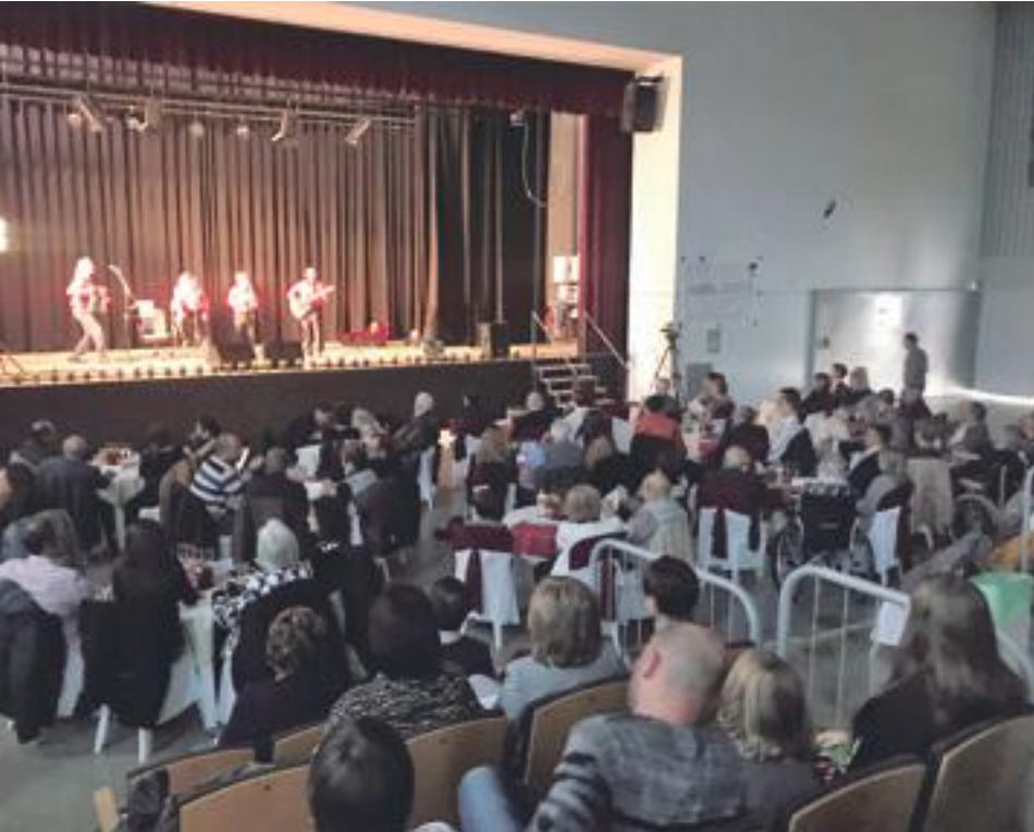
■ La celebració de l'Homenatge als Octogenaris de les Borges 2018

Les Borges Blanques va acollir el diumenge 28 d'octubre, la 9a edició de l'Homenatge als Octogenaris, un acte organitzat per la regidoria de Benestar Social, Família i Salut al Pavelló de l'Oli. En l'acte es van reconèixer els 17 borgencs i borgencques que enguany celebren el seu 80è aniversari, ja que van néixer el 1938. A tots ells se'ls va entregar una medalla i un diploma acreditatius de l'efemèride, a més a més d'una fotografia de grup i d'una altra individual, com a recordatori de la festa. L'acte va aplegar unes 120 persones, que van voler acompanyar els seus familiars octogenaris homenatjats.