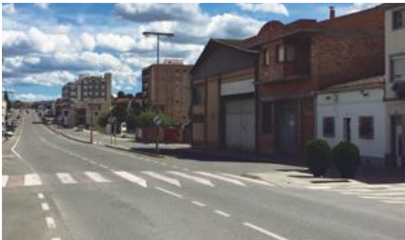
■ L'Avinguda Francesc Macià de les Borges Blanques

En l'amistós jugat a les Borges, els blaugranes van despertar una gran expectació entre el públic i van començar a desmarcar-se de l'equip rival tot just començar, a l'equador del primer quart. En el transcurs del matx en què van anotar els 12 jugadors del Barça, l'equip català va convertir 11 triples de 22. Tota una demostració de força dels blaugranes davant d'un jove equip serví que es va veure superat en tots els vessants del joc. ■