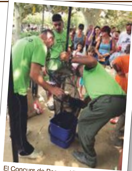
El Concurs de Pesca al Terrall de la Festa Major de les Borges