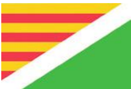
■ Proposta Bandera 1

Cal recordar que, amb l'adopció de la nova bandera oficial de les Borges, l'Ajuntament de la capital de les Garrigues dona compliment de la Llei municipal i del règim local de Catalunya, ja que els nous elements de l'escut respecten la normativa heràldica i es fonamenten en fets històrics i geogràfics de les Borges. Així doncs, amb la nova bandera es corregeixen algunes anomalies com ara la presència d'una vaca en lloc d'un bou i la corona superior, que no es corresponen amb la història del municipi.