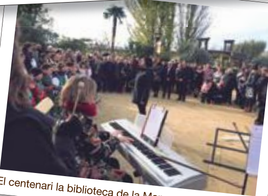
El centenari la biblioteca de la Mancomunitat