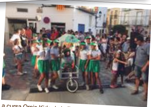
La cursa Omnis Kids de la Festa Major de les Borges 2018