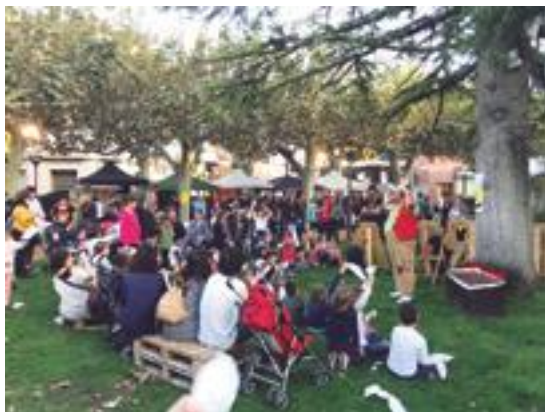
■ Menuts i grans gaudint de l'actuació del pallasso Biel

Durant el període de preinscripcions a la 56a edició de la Fira de l'Oli Qualitat Verge Extra i les Garrigues, que tindrà lloc del 18 al 20 de gener de 2019 a les Borges, un total de 91 expositors van formalitzar la participació, unes xifres mai assolides fins ara, a falta de més de 75 dies per a la celebració del certamen.