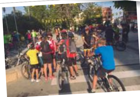
El Dia de la Bicicleta 2018 a les Borges