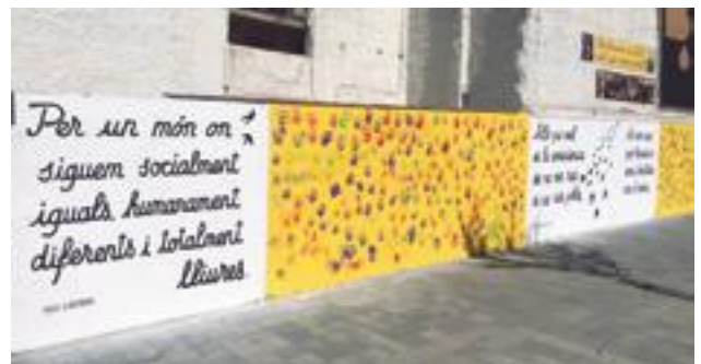
■ El mural reivindicatiu en record de l'1 d'octubre elaborat pels infants borgenca