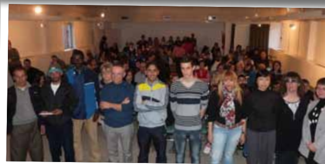
Dia Mundial de la Poesia a la biblioteca Marquès d'Olivart.