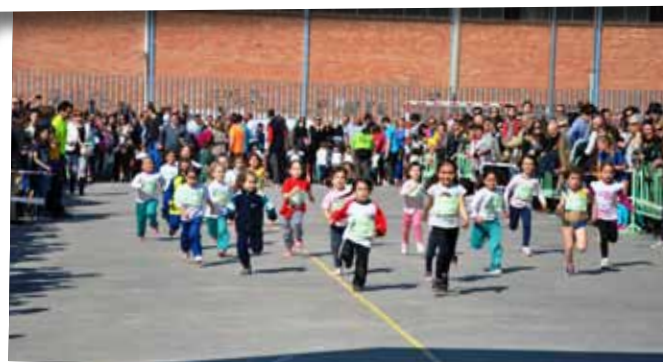
I Cros Intercomarcal Ciutat de les Borges.