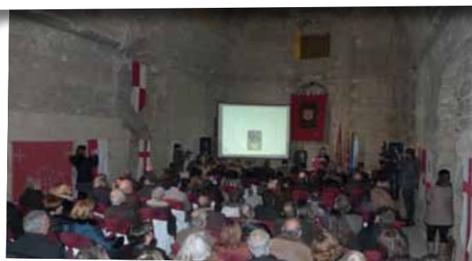
Presentació de la Fira de l'Oli al Castell dels Templers de Lleida.