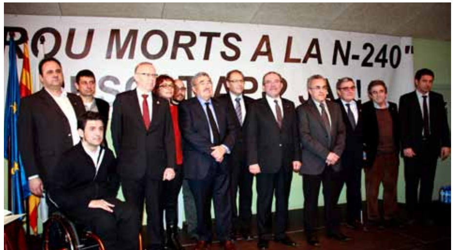
■ Demostració d'unitat de les institucions i representants de la societat civil per exigir a Foment la gratuïtat del peatge de l'AP-2 que permetria posar fi a l'elevada sinistralitat de la N-240.

Les Borges ha reivindicat la fi de l'elevada sinistralitat a la N-240, amb les Cambres de Lleida i Reus, l'Ateneu Popular Garriguenc, Conca 22, i les poblacions afectades, en la Declaració de Montblanc-Les Borges-Lleida, exigint una solució definitiva al greuge que patim per la manca d'inversió del Ministeri de Foment.