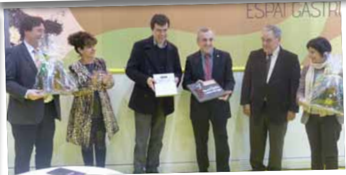
Agermanament entre la Fira de l'Oli i la Ruta del Vi DO Costers Segre.