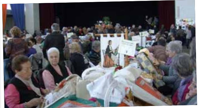
Més de 600 puntaires es donen cita al Pavelló de l'Oli.