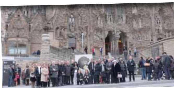
Presentació del certamen al Temple de la Sagrada Família.