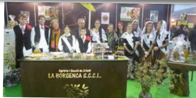
Les pubilles i hereus de Catalunya van poder gaudir de la Fira.