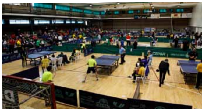
Campionat de Catalunya de tennis taula i bàdminton organitzat per Acell.