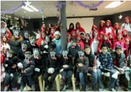
■ Carnestoltes a l'Associació Grums.