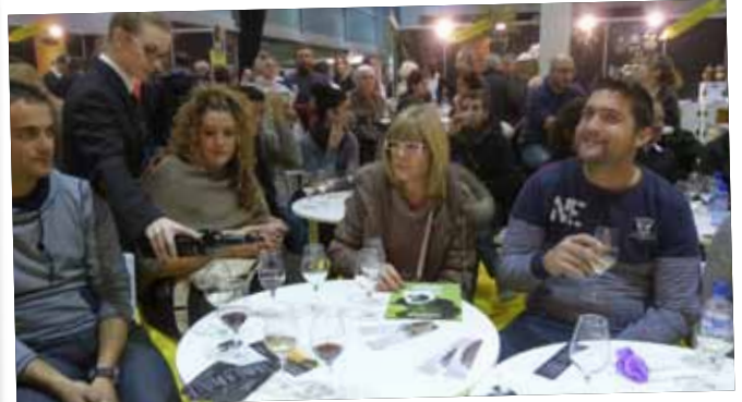
Tast de vins del Celler Clos Pons.