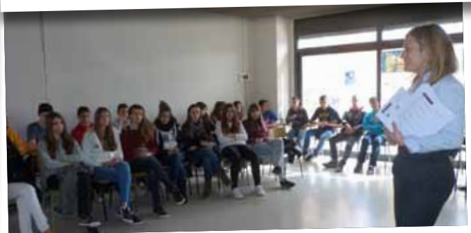
Taller d'educació financera al col·legi Mare de Déu de Montserrat.