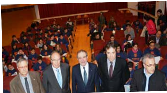
Les Borges s'incorpora al programa FutbolNet juntament amb Bellpuig i Almacelles.