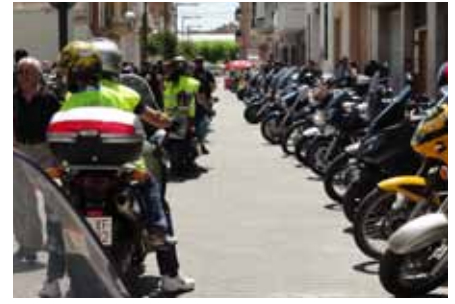
■ Trobada motard a les Borges.

El Casal de Gent Gran de les Borges Blanques, adscrit a la Direcció General d'Acció Cívica i Comunitària del Departament de Benestar i Família, es va inaugurar l'any 1975 i actualment té més de 2000 persones usuàries inscrites. És un equipament cívic destinat al col·lectiu de les persones grans i té com a finalitat promoure el seu benestar i la seva participació com a membres actius de la societat. Dins del marc del civisme com a eix vertebrador, ofereixen als usuaris serveis i activitats i col·laboren amb el teixit associatiu cedint a les entitats l'ús d'espais per fer activitats de caire cívic i social. Al Casal hi té la seva seu social l'Associació de Gent Gran les Garrigues que ofereix als seus més de 700 socis/sòcies diverses activitats lúdiques, festives, esportives i culturals. ■