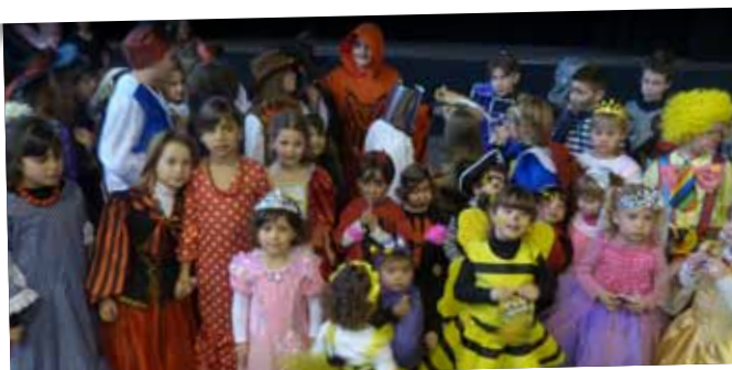
Carnestoltes infantil al Pavelló de l'Oli