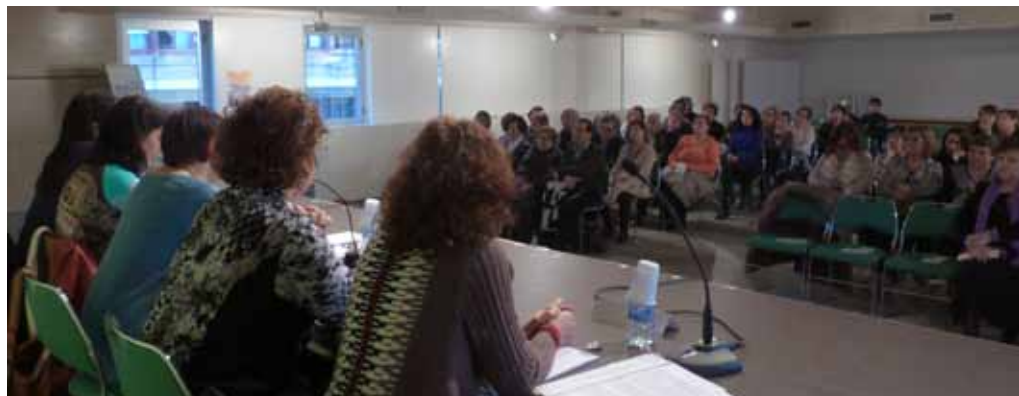
■ Cinc dones de les Borges van protagonitzar la taula rodona "Sentiments en veu de dona" el passat 8 de març.

La regidoria de Benestar Social i Família ha organitzat al llarg de cinc mesos el cicle "Especial Dona", conjuntament amb el Servei d'Informació i Atenció a les Dones (SIAD) del Consell Comarcal, la biblioteca Marquès d'Olivart i la col·laboració de l'Associació de Dones La Rosada. Aquest any s'ha apostat per treballar les "emocions" i així donar eines suficients per poder gestionar aquestes, en els diferents moments i situacions de la vida quotidiana. Per aquest motiu el cicle va començar el passat 25 de novembre, Dia Internacional contra la Violència de Gènere, amb la xerrada-taller "Reinventat. Gestió emocional en temps