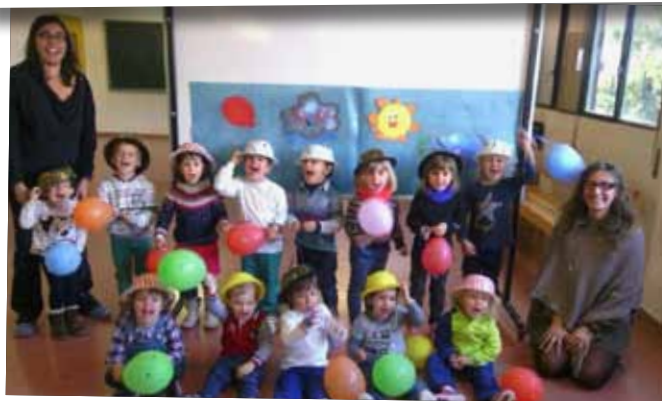
L'Escola de Música de les Garrigues celebra la Setmana Cultural.