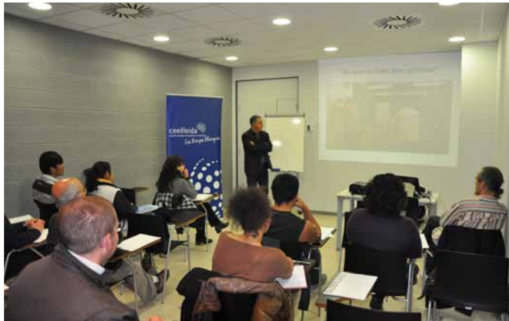
■ Els seminaris gratuïts de creació d'empreses innovadores "Dijous emprenedors" al CEI Borges.

Ara el proper repte és el poder aconseguir que encara més gent