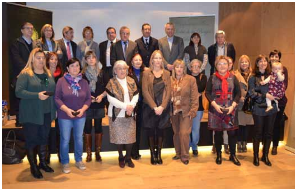
■ Dia de la Comarca dedicat a les dones garriguenques.

I el 27 de març, l'Oficina Jove, juntament amb l'àrea de promoció econò-