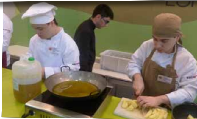
Demostració de cuina de l'Escola d'Hoteleria de Lleida.