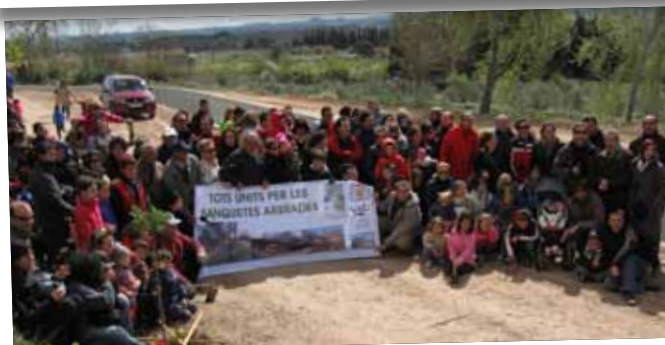
Plantada d'arbres conjunta entre les Borges i Juneda en defensa de la Banqueta.