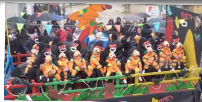
Els alumnes de la Llar d'Infants Joan XXIII, durant els Tres Tombs de Sant Antoni.