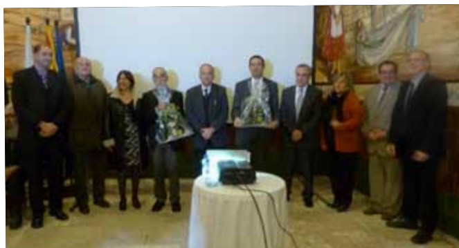
Presentació de la Fira al Parc Temàtic de l'Oli.