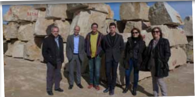
Visita a la planta on s'elaboren les pedres de la Sagrada Família.