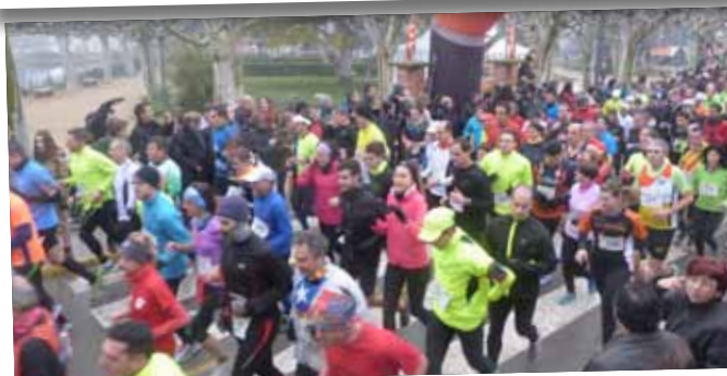
La Cursa de l'Oli celebra l'11a edició.