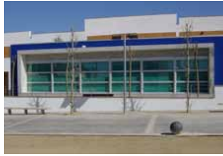
■ Casal de la Gent Gran.

L'any 1990 va nèixer a les Borges l'Associació de Pares i Joves Club Juvenil Rio, l'actual Club juvenil Grums, amb l'objectiu de crear un espai de lleure pels joves des de 6è de primària fins a l'ESO. Per aquest motiu ofereix activitats tots els diumenges i festius a la tarda a la sala de l'entitat, on s'hi pot trobar servei de bar, discoteca, zona de projeccions multimèdia, billar, futbolins i tennis de taula entre altres. L'entitat sociocultural, que compta amb una seixantena de socis joves, també organitza mensualment cursos de ball de saló, tai-xi i aeròbic, a més de sopar i ball pels associats. L'Associació Grums compta també amb el suport de socis col·laboradors i patrocinadors i participa en activitats que transcendeixen de l'àmbit de la pròpia associació com són la participació amb una carrossa als Tres Tombs, els actes pro Marató de TV3 i altres esdeveniments de caire solidari que s'organitzen a la població, a més de la commemoració de les principals festes de tradició catalana. ■