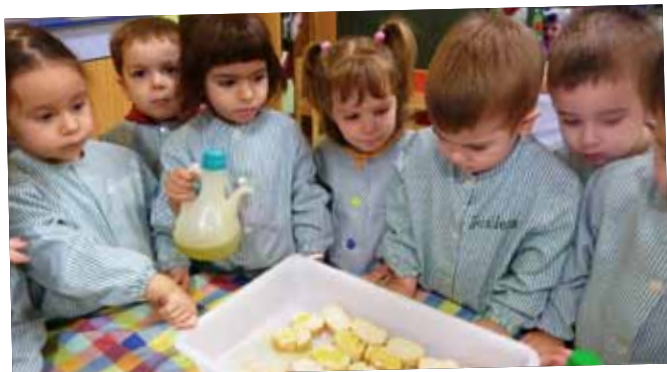
Els més petits esmorzen pa amb oli a l'escola.