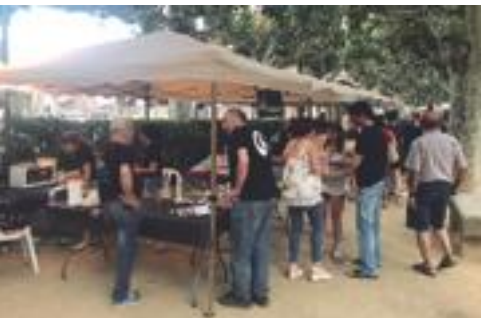
■ Participants durant la IV edició de la Ruta de la Tapa al Terrall.