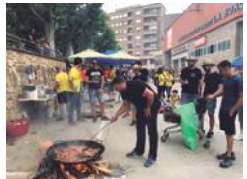
El Concurs de Paelles al Terrall 2018

Amb l'objectiu de compartir una jornada de convivència i gastronomia, el Concurs de Paelles de les Borges va acollir centenars de participants que van gaudir d'una jornada lúdica acompanyada de xaranga i batucada, a càrrec dels Diables i Tabalers del Grup de Recerca de les Borges. En el transcurs del dinar, es van lliurar 4 categories de premi: a la Millor Paella, a la Millor Paella Jove, a la Taula més ben guarnida i a la Colla més participativa per nombre de membres. ■