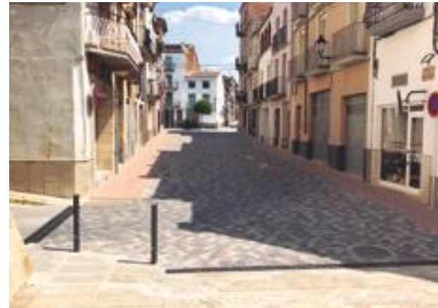
■ El carrer Santa Vedruna de les Borges amb els treballs d'arranjament finalitzats

Les obres, incloses en el Pla de Barris es van iniciar a mitjans d'abril i les ha executat un constructor local per un import final de 65.084,52 euros, IVA inclòs. Destaquen la substitució dels paviments existents i l'anivellament de la calçada i les voreres amb materials similars als utilitzats a la plaça Abadia, al carrer Abadia i al carrer Carnisseria, amb la finalitat d'integrar tot l'àmbit al voltant de l'Església de l'Assumpció de Maria i l'alineament de la façana d'aquesta. També s'ha dut a terme la substitució de la claveguera, que ha comportat la millora de la subbase del paviment del carrer, i s'han substituït finalment les escomeses d'aigua potable de totes les vivendes del carrer.