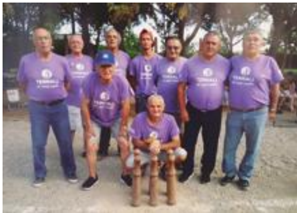
■ Equip de Bitlles de les Borges

Les bitlles són un esport tradicional català consistent en llançar uns "bitllots" (bitlles petites) contra unes bitlles situades a una determinada distància a fi de tombar-les. Una partida consta de 9 tirades per jugador dividides en 3 rondes de 3 tirades. A cada tirada es poden llançar d'un a 3 bitllots i l'objectiu és el que s'anomena "fer bitlla", és a dir, tombar cinc de les sis bitlles.