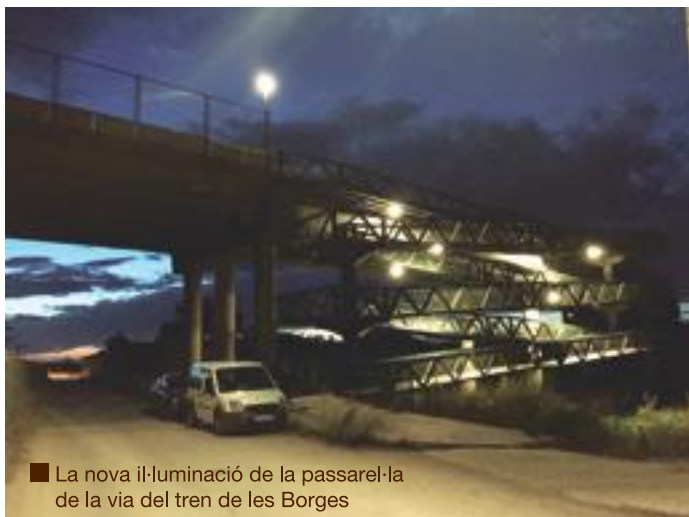
■ La nova il·luminació de la passarel·la de la via del tren de les Borges

El Ple de les Borges Blanques va aprovar el 26 de juliol la pròrroga que servirà per a realitzar millores i arranjar alguns carrers més del Centre Històric de les Borges, en funció del que els tècnics valorin i del que la disponibilitat pressupostària permeti. Amb aquestes actuacions es pretén donar continuació a les actuacions de dignificació del casc antic del municipi, complementant les inversions dutes a terme en el marc del Projecte d'Intervenció integral del Barri del Casc Antic i de l'Entorn Urbà Històric de la capital de les Garrigues.