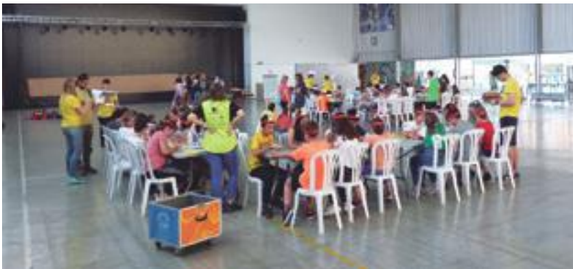
■ La IV edició de l'English Day va reunir 194 alumnes als pavellons de les Borges

D'altra banda, la Biblioteca va participar el 25 de maig a la Supernit de les biblioteques, una iniciativa per fomentar la lectura entre el públic infantil, en la qual hi van participar 277 biblioteques de 207 municipis diferents. ■