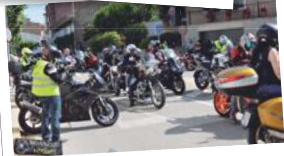
La XIVa Trobada Motera 2018 de les Borges