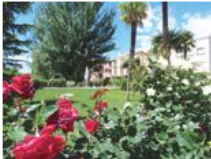
■ El Parc del Terrall engalanat per al concurs Garrigues en Flor 2018

L'Ajuntament de les Borges Blanques ha iniciat l'expedient de contractació i el plec de clàusules administratives particulars de l'obra d'adequació de l'antic Escorxador Municipal, per convertir-lo en un Hotel d'Entitats, amb diverses sales per acollir el teixit associatiu de la capital de les Garrigues.