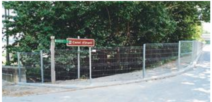
■ La nova tanca de seguretat del Canal d'Urgell al carrer Ramon Cornudella de les Borges

Per tal de millorar la seguretat a la població i evitar possibles caigudes o accidents, donada la proximitat d'un grup d'habitatges amb nombrosos infants, l'Ajuntament de les Borges Blanques ha instal·lat una nova tanca metàl·lica, de més de 100 metres de llargada per 1,50 metres d'alçada, de separació amb el Canal d'Urgell, a l'alçada del carrer Ramon Cornudella.