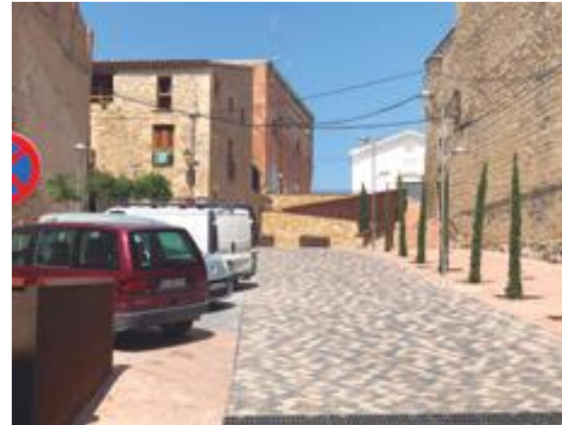
■ El carrer i la Plaça Abadia, una vegada finalitzats els treballs de millora

encara hi hagi partida econòmica disponible. Igualment, dins d'aquesta previsió d'ampliació d'obres s'està analitzant amb els tècnics municipals quines actuacions es poden incloure dins d'aquesta mateixa anualitat 2018. Aquí des de l'Equip de Govern voldríem donar cabuda a la millora del carrer Hospital, per finalitzar aquesta anella de renovació del terra dels vials del Nucli Antic, aprofitant que ja estava prevista en el Pla de Barris. A la vegada, i fora d'aquest àmbit pròpiament, també tenim la voluntat de renovació i ampliació del Bar "Els Jardins", al Passeig del Terrall, per finals de temporada d'estiu. Una obra que ens sembla tan necessari com convenient, després de més de 40 anys de la seva implantació, a la vista de l'evolució del servei de cafeteria i també per la seva estratègica ubicació, dins d'aquest recinte tan emblemàtic i concorregut.