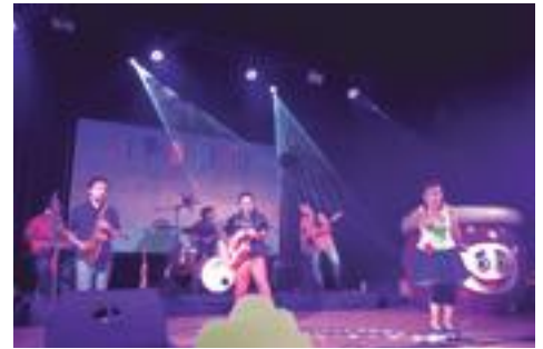
■ Actuació del grup "Pot petit" al 1r Lo Festival de les Borges

L'organització de l'acte va destinar un euro de cada entrada venuda a l'Associació Pallapupas, els pallassos d'hospital que, sota el lema "Riure omple de vida", treballen perquè hi hagi un espai per a l'humor durant l'hospitalització. A més a més, a través de la Policia Local, l'organització col·labora amb l'Hospital de Sant Joan de Déu amb la campanya #pelsvalents, venent escuts de roba i paper dels agents de seguretat, per aconseguir diners per a construir el Pediatric Cancer Center, el centre oncològic infantil més gran d'Europa.