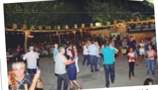
Festa de Sant Cristífol 2018, al recinte de la Font Vella