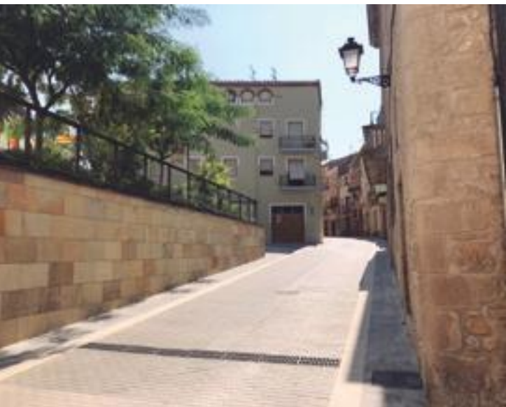
■ El carrer Concepció Soler amb els treballs d'arranjament finalitzats