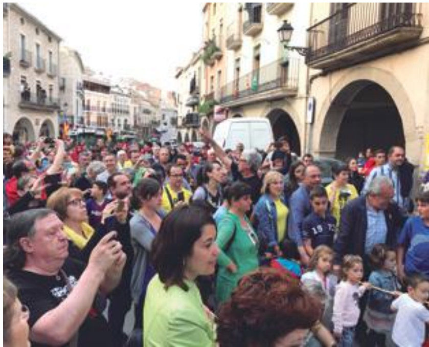
■ La nova plaça 1 d'octubre plena de gent durant el seu renombrament

Igualment, el mateix dissabte va tenir lloc una caminada de descoberta i reivindicació de l'Espai Natural Protegit dels Bessons, organitzada per Centre Excursionista Borges-Garrigues, l'Ateneu Popular Garriguenc, La Banqueta i el Club Ciclista Colla la Pedalada, de Juneda, Boira Experience i Espais Naturals de Ponent.