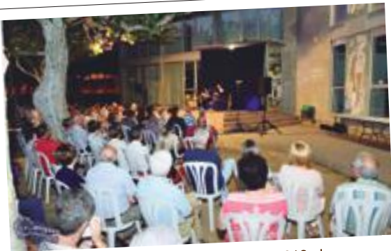
El concert del Garrigues Guitar Festival 2018 al Parc del Terrall