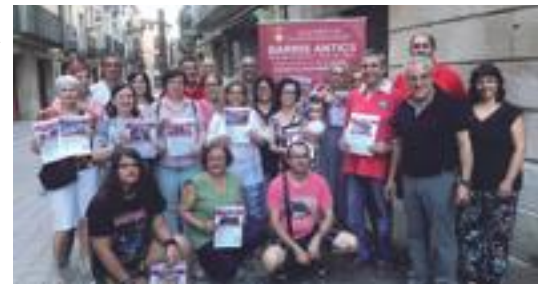
■ Imatge dels premiats en la campanya "Barris Antics"

A més a més, al llarg de l'any, el centre ha organitzat diferents càpsules formatives per a la millora de la gestió empresarial; l'última, dedicada al WhatsApp.