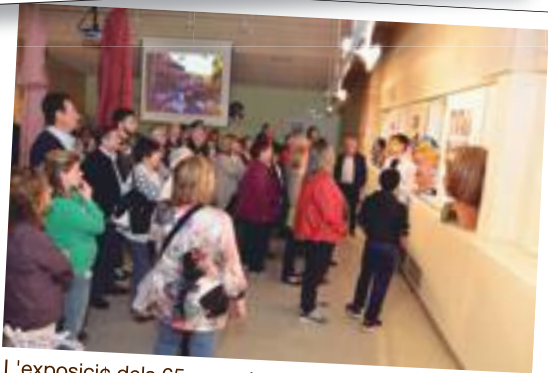
L'exposició dels 65 anys dels gegants Peronella i Ramon Berenguer IV, a la Sala Maria Lois