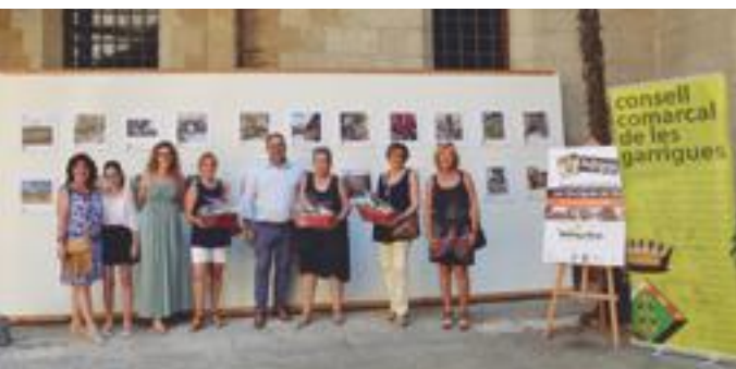
■ Expo Instagram (Foto de grup)

Del 19 de maig al 3 de juny, un total de 228 veïns i veïnes de 23 pobles de les Garrigues han participat en la segona edició del concurs “ Les Garrigues en Flor ” organitzat pel Consell Comarcal per embellir els pobles de la comarca amb plantes i flors naturals, amb l'objectiu de fomentar l'orgull i l'estima cap a la comarca, tant dels mateixos habitants dels pobles garriguencs com dels turistes que la visiten.