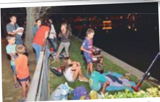
Marató de 12 hores de pesca a les Basses del Terrall