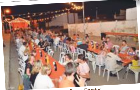
Festa Major del Barri de les Cases Barates