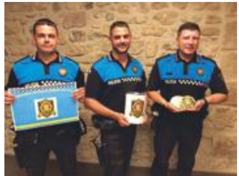
■ La Policia Local de les Borges presentant la campanya #pelsvalents

Del 3 al 26 d'agost, l'artista lleidatana Marina Dalmau exposa al mateix recinte la seva obra 'Retalls i Colors'. L'exposició, plena de color, tracta sobre el collage, composicions de retalls de roba, papers, fils i teles.