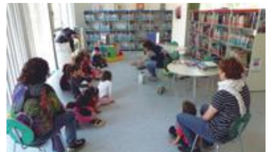
■ Grup escolar en una sessió de conta contes a la Biblioteca de les Borges

CONSUM ELEVAT? FUM NEGRE? FALTA DE POTÈNCIA?