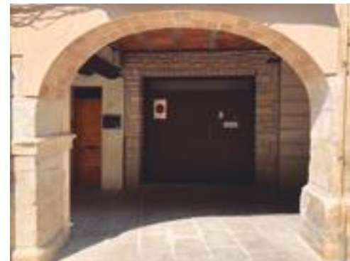
■ Una arcada restaurada recentment a la Plaça de l'1 d'octubre