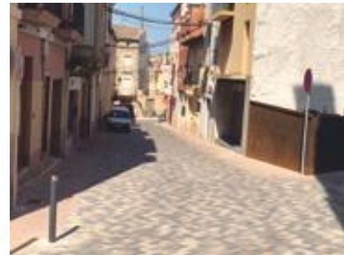
■ El carrer Carnisseria arrançat amb el Pla de Barris

Arran de tot plegat, des del consistori ens omple d'orgull poder iniciar una campanya de dinamització turística de la població, per a la qual hem elaborat una marca turística que ens posiciona com a capital de l'oli. Així, coincidint amb la finalització de les darreres actuacions del Pla de Barris, tenim prevista una gran jornada ciutadana de posada en servei dels carrers arrançats i de les darreres millores fetes a l'antic Molí d'Oli de Cal Gineret, on hi haurà portes obertes als nostres equipaments culturals, una gran cercavila popular i la presentació d'aquesta nova imatge turística, que també posa en valor el potencial de la nostra indústria agroalimentària. ■