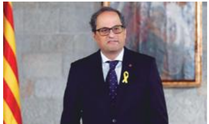
■ El president Quim Torra