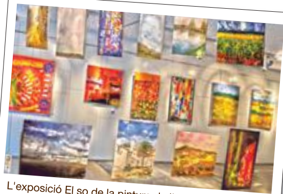
L'exposició El so de la pintura de l'artista Tines, a la Sala Arts25400