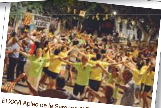
El XXVI Aplec de la Sardana Al Terrall