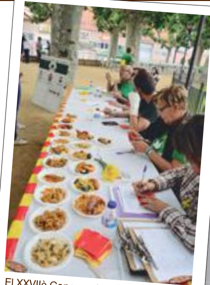
El XXVIIè Concurs de paelles al Terrall