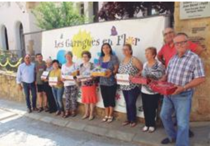
■ Guanyadors del Concurs (Foto de grup)