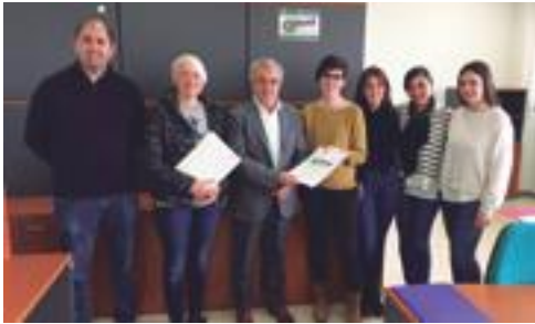
■ L'alcalde de les Borges dona la benvinguda a l'Associació Talma al CEI de la capital garriguenca

L'Ajuntament de les Borges ha signat un conveni de col·laboració amb l'associació Talma que permetrà a una persona de l'entitat realitzar pràctiques com a auxiliar a la Biblioteca pública Marquès d'Olivart. En concret, el conveni estableix un període de pràctiques a la Biblioteca de les Borges, situada al passeig del Terrall de la capital de les Garrigues. Les pràctiques es duran a terme del 16 de juliol a l'11 d'octubre i tindran una durada diària de 5 hores.