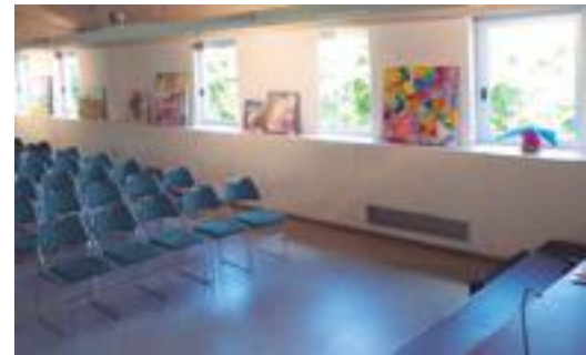
■ L'exposició col·lectiva del projecte Creativitat i Salut Mental a la Sala Maria Lois

Seguint en l'àmbit socioeducatiu, el passat 1 de juny va tenir lloc a la capital garriguenca una taula rodona sobre refugiats sahrauís. Durant l'acte, membres de l'Associació Lleida pels refugiats, així com la Delegació catalana de la Lliga d'estudiants sahrauís van aportar testimonis i informació de primera mà sobre la situació i van presentar el projecte "Vacances en pau".