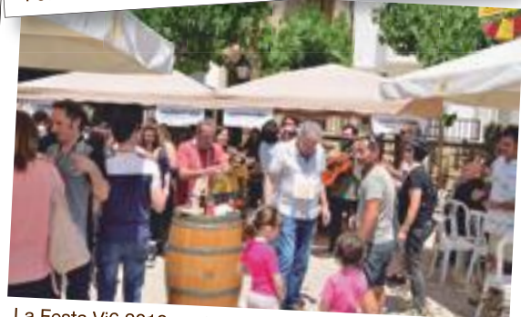
La Festa Vi6 2018, amb els 6 cellers de vins de les Garrigues