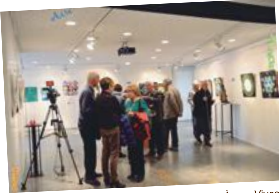
L'exposició l'Ànima de la matèria, de l'artista Àurea Vives, a la Sala Arts25400

Butlletí d'informació municipal Agost 2018 | Num. 20