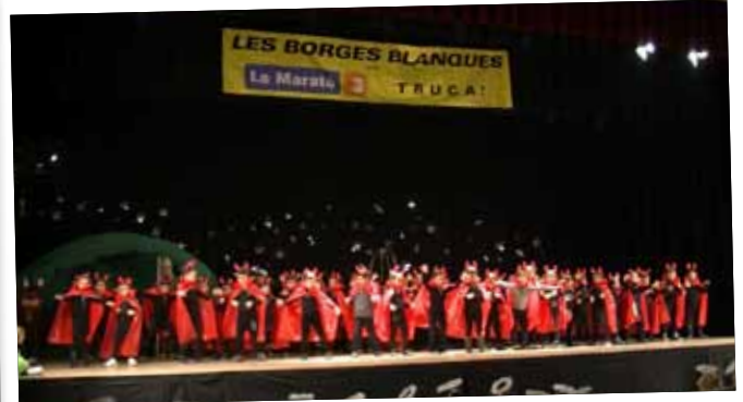
Actuació dels infants en benefici de La Marató de TV3.