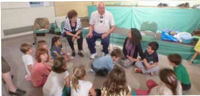
Projecte d'Acció Local Jocs Antics i Tradicionals a la Biblioteca Marquès d'Olivart.