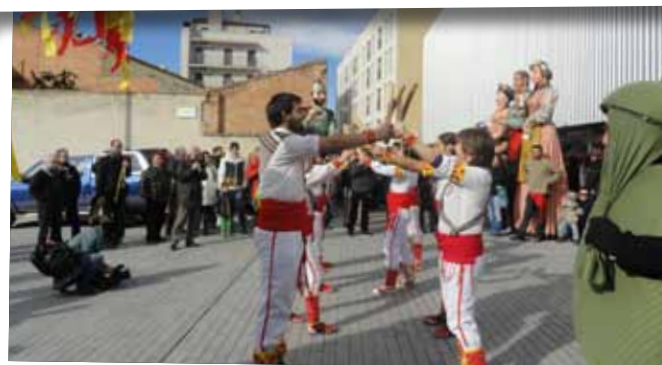
Celebració de la Festa de la Independència (versió beta) i Fira Aficionàlia.