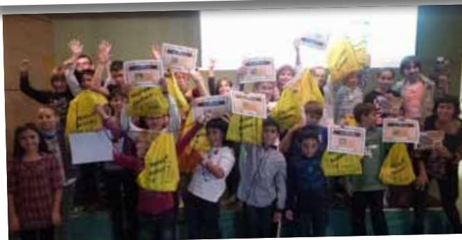
Promoció de la lectura entre els infants a través de la Bibliocursa.