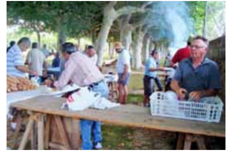
■ Festa de Sant Cristòfol.

El Club Atlètic Borges és una entitat esportiva creada l'any 2003 per una colla d'amics amants de l'atletisme. Durant el primer any de vida, el club incorpora esportistes i es marca els objectius més immediats: formar un grup per realitzar els entrenaments conjunts, marcar una sèrie de circuits pel terme de les Borges i crear una cursa atlètica al municipi. Aquest últim es va fer realitat el gener del 2004, quan aprofitant la Fira de l'Oli el Club Atlètic Borges crea la I Cursa de l'Oli, una cita consolidada al calendari de curses lleidatà en el gener de 2014 celebrarà la seva 11a edició amb més de 800 atletes inscrits. Des de llavors, l'entitat s'ha anat fent gran -ara compta amb més de 100 socis dels quals bona part són menors de 30 anys- i diàriament es dona a conèixer arreu de Catalunya a través de les diferents proves en les que prenen part els seus corredors. ■