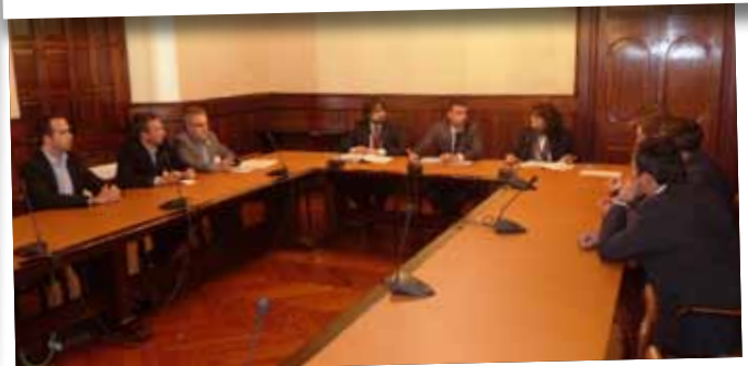
Reunió dels alcaldes integrants de la Plataforma Prou morts a la N-240 amb el conseller d'Interior, Santi Vila.