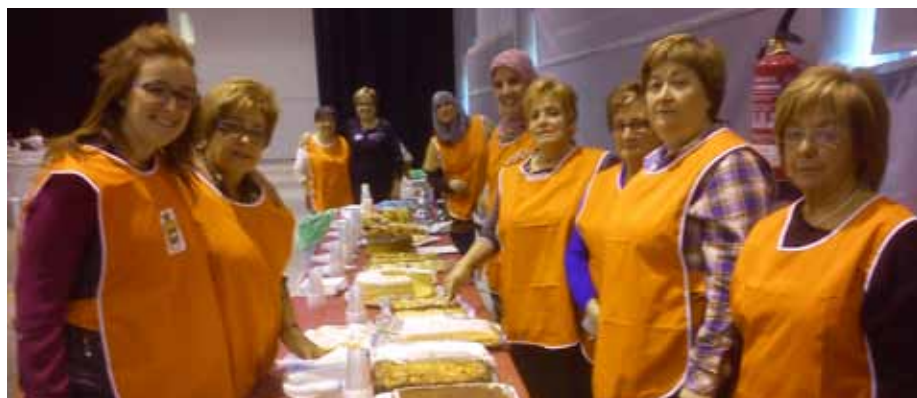
■ Voluntàries musulmanes i integrants de l'Associació de dones La Rosada van confeccionar el berenar pel Festival d'Entitats.

Des de fa dos mesos la regidoria de Benestar Social i Família coordina una activitat d'integració social de les persones immigrants a través del voluntariat, amb un únic objectiu: aconseguir que les dones novingudes puguin ser autosuficients i no necessitin l'ajuda d'altres familiars en el seu dia a dia al municipi. L'activitat, que va començar amb cinc participants, ja sobrepassa actualment la vintena de voluntàries musulmanes que cada dimarts al matí es troben al Centre Cívic i s'ajuden les unes a les altres en diferents activitats, com cosir o tenir cura dels infants, alhora que comparteixen una llengua comuna: el