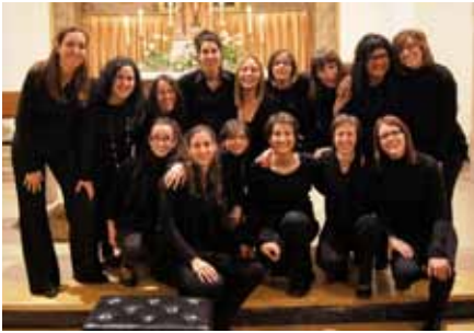
■ Les integrants del Cor Eurídice.