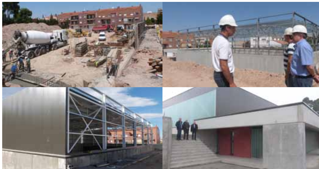
■ El nou equipament, al servei dels esportistes després de gairebé un any d'obres.

El Centre de Tecnificació de Tennis Taula ja està gairebé del tot llest per la seva obertura, prevista per mitjans de febrer, quan els equips que integren el Club Tennis Taula Borges es traslladaran al nou equipament de manera definitiva. La construcció de l'edifici d'alt rendiment esportiu, ubicat al xamfrà de l'Avinguda Francesc Macià amb el carrer Maria Codina, ja han quedat acabats i només queda pendent la instal·lació de la il·luminació, amb un sistema de tecnologia LED que permetrà la regulació de la intensitat lumínica amb un estalvi energètic important, i la instal·lació del sistema de calefacció a la pista. Pel que fa a l'interior, l'edifici compta amb dos zones diferenciades. L'esportiva, formada per una pista de 705 m 2 amb cabuda per a 12 taules reglamentàries de manera simultània i amb graderies mòbils amb capacitat per a 55 persones, i la zona de serveis, on s'hi ubiquen la recepció, els banys i la zona de vestidors. L'acondicionament exterior compta amb una característica singular: la instal·lació de vidre U-glas a la cara Nord, el que proporcionarà molta claror a la zona poliesportiva. També s'ha adequat l'exterior del recinte, amb la plantació de diversos