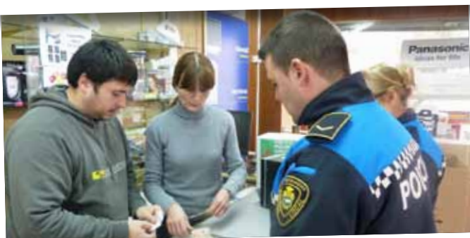
Campanya "Comerç Segur" als establiments de les Borges.