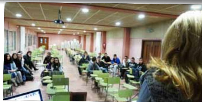
Sessió formativa 'Joves emprenedors' a l'INS Josep Vallverdú.