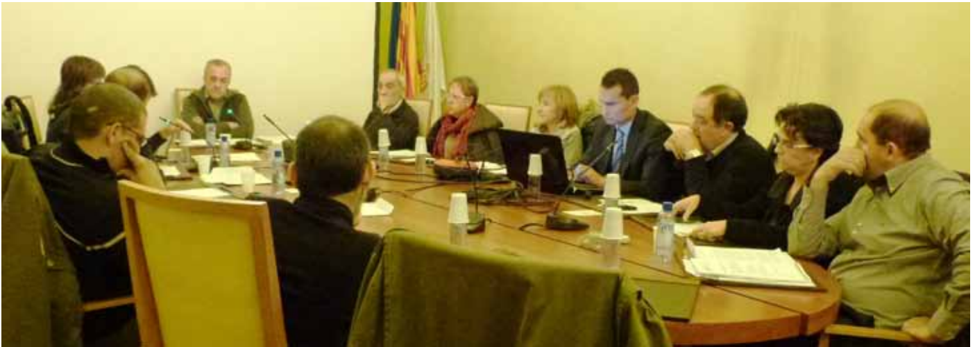
■ Imatge de la darrera sessió plenària on l'auditor va presentar les seves conclusions.

El consistori, complint una promesa electoral, ha efectuat l'auditoria de gestió i comptable de l'Ajuntament per a l'exercici 2007-2010. Entre les anomalies detectades en destaca el litigi que van emprendre dos representants d'ERC arran de la compra del solar de l'antiga caserna de la Guardià Civil contra el mateix Ajuntament (governat per CIU i els IBB durant el període 2003-2007), buscant defectes de procediment i impugnant el conveni redactat, el qual era imprescindible per a poder escripturar la propietat del solar en benefici del municipi, ja que l'Ajuntament no dispo-