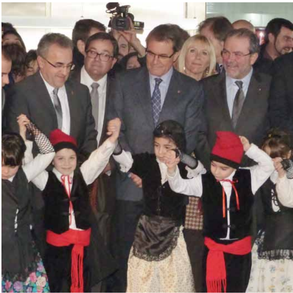
■ El president Mas va inaugurar la passada edició de la Fira de l'Oli Qualitat Verge Extra i les Garrigues en un multitudinari acte que va comptar amb la presència de centenars de veïns.

L'edició d'enguany ha ampliat fins a 6.363 el metres quadrats d'exposició, repartits entre el Pavelló de l'Oli i el Pavelló Comercial. També s'ha guanyat superfície al recinte exterior, amb la incorporació de nous carrers com el