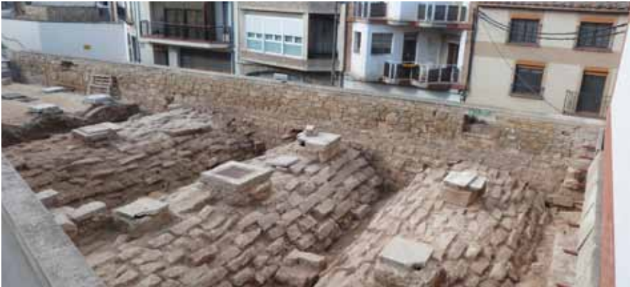
■ Cal Gineret és un dels 60 molins que antigament treballaven a la capital de les Garrigues.

Dins del nou pla de dinamització turística, cultural i patrimonial que ha impulsat la regidoria de Cultura de les Borges compta amb especial rellevància la rehabilitació del molí d'oli de Cal Gineret, una construcció de finals del segle XIX que va ser utilitzada pels veïns de les Borges com a refugi antiaeri durant la Guerra Civil. Els treballs, que van començar la primera setmana de novembre, consisteixen en la pavimentació de tot l'espai de la coberta i en la recuperació de les voltes de pedra existents i dels dotze lluernaris dels cuba d'oli per mantenir la il·luminació i la ventilació de l'espai interior. Segons el regidor de Cul-