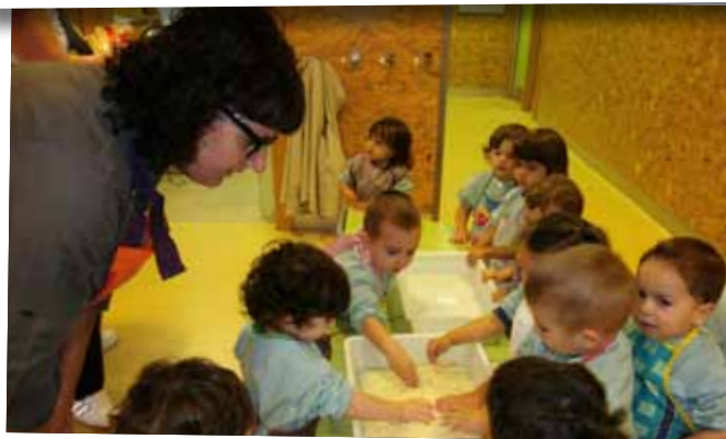
Elaboració de panellets a la Llar d'Infants durant la Castanyada.