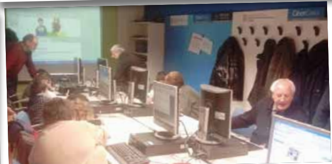
Trobada entre els padrins voluntaris i els infants del Centre Obert.