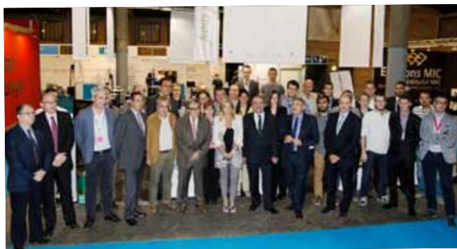
Participació de les empreses del CEI Borges a Micipàlia