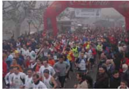
■ Cursa de l'Oli.