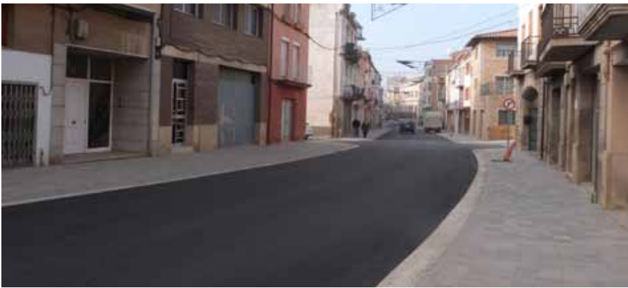
■ L'antiga N-240, una de les principals artèries circulatòries del municipi, llueix un nou aspecte.

Després de sis mesos d'actuacions, l'Ajuntament va obrir al trànsit el passat 7 de desembre l'antiga carretera N-240 en el tram comprès entre el Terrall i el Raval del Carne a l'alçada del carrer 11 de Setembre, on s'enllaça amb la primera fase de les obres. Aquest segon tram, d'uns 600 metres de longitud, també està finançat pel Ministeri de Foment, ja que l'actuació forma part de les obres de millora dels trams urbans de la xarxa de carreteres que van cedir al municipi. El pressupost de l'actuació és de 381.554 euros més IVA, amb els