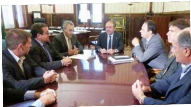
Reunió entre els alcaldes de la plataforma Prou morts a la N-240 i el president de la Diputació, Joan Reñé.