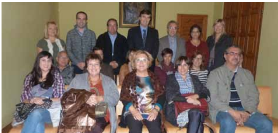
■ Representants d'entitats, associacions locals, i personalitats polítiques, a la signatura del Pla Educatiu d'Entorn.

El passat 11 de novembre l'Ajuntament i el departament d'Ensenyament de la Generalitat van signar el conveni que posava en marxa el Pla Educatiu d'Entorn a les Borges, una iniciativa que vol aconseguir l'èxit educatiu de tot l'alumnat i promoure la cohesió social a través de la implicació del teixit associatiu municipal. Per aquest motiu, a l'acte també hi van assistir els representants dels sis centres educatius de la població -les dos escoles (Joan XXIII i Mare de Déu de Montserrat) i les seves llars d'infants, l'INS Josep Vallverdú i l'Escola de Capacitació Agrària- a més dels representants