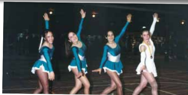
1996 PATINADORES DEL CLUB