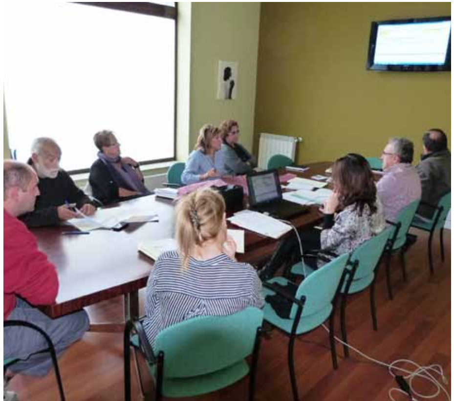
■ Reunió recent de la Junta de Govern Local

L'objectiu dels actuals governants és mantenir i seguir millorant el nivell de serveis municipals, sense reper-cutir-ho econòmicament a la ciuta-dania. L'estalvi anual en la despesa corrent aconseguir aquests darrers exercicis, d'entre 400.000 i 500.000 euros de mitjana, permet compensar increments significatius de la despesa com han estat l'augment de l'IVA, que l'Ajuntament no recupera, el descens dels ingressos procedents dels tributs que recapta l'Estat, i l'augment de la despesa financera, per amortitzar i re-baixar el deute bancari.