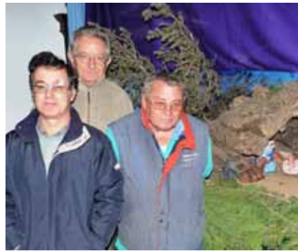
■ L'Associació de Pessebristes preparant el naixement a les Borges.

Fundada l'any 1954, la Banda de Cornetes i Tambors és una entitat sense ànim de lucre integrada per 20 homes i 5 dones, dels quals hi ha 5 infants, entre 7 i 10 anys. Habitualment actuen a la Cavalcada de Reis, Tres Tombs de Sant Antoni, Processó de Setmana Santa i Festa Major. A més, participen en activitats a la Residència de Gent Gran, entre d'altres entitats, i en actes arreu del Territori, i han arribat a tocar a València, França i al Camp Nou. Assagen cada divendres als baixos del Pavelló de l'Oli durant tot l'any i fa 6 anys que es van unir amb la Banda del Molí Vell de Juneda. Ara, a més de les Borges hi ha gent de Torregrossa, Torres de Segre, Arbeca i Juneda, i sovint surten acompanyats del Grup de Majorettes de Lleida. ■