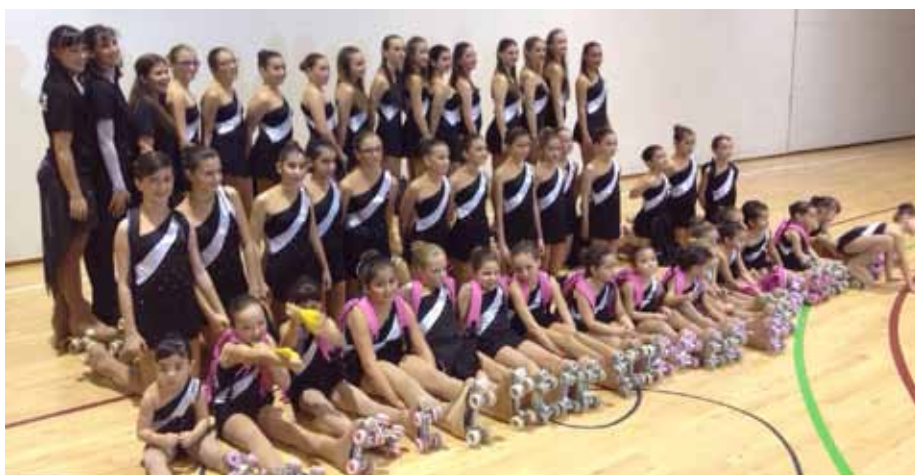
■ Les integrants actuals del Club Patí Borges

El Club Patí Borges va celebrar a finals de novembre el seu XXX aniversari amb una exhibició al Poliesportiu Francesc Macià. En l'acte van participar els tres grups de patinadores del club borgenc, petites, mitjanes i grans, i també va servir per presentar el nou equip Juvenil de Grup Shows, que participarà en el campionat provincial del gener.