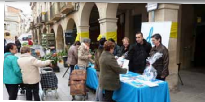
Taula informativa pel Dia mundial de la Diabetis.