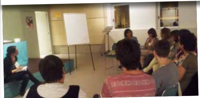
Reunió del programa Crèixer en família.