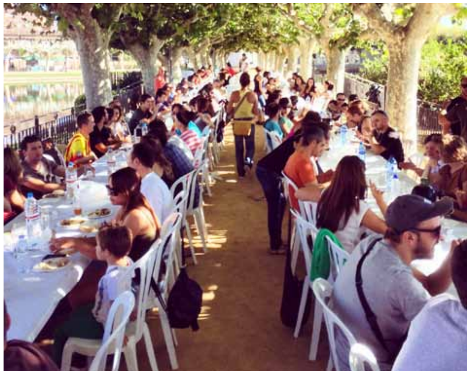
■ Dinar popular de la primera Firra de les Borges Blanques.

D'altra banda, la primera edició de la Firra, sorgida de la iniciativa i col·laboració d'un grup de joves garriguencs, es va celebrar a mitjans d'octubre al Parc del Terrall amb el suport de l'Ajuntament i la cerveseria O'Brothers. Allí s'hi van congrega més d'un miler de persones al voltant de les nou parades d'elaboradors que oferien una trentena de cerveses diferents, dos tallers d'elaboració de