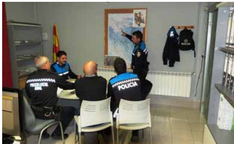
■ Agents de la Policia Local de les Borges preparant un operatiu a les seves dependències.

La Policia Local de les Borges s'encarrega de garantir la nostra seguretat, del nostre ordre públic i de la convivència de tots els habitants durant les 24 hores del dia. També s'encarreguen d'atendre telefònicament i presencialment a les persones que necessiten assistència, acompanyament o atenció. A més, també s'ocupen de desenvolupar serveis planificats com els punts de control i vigilància estàtics, les rondes a peu o en vehicle pel municipi, la comprovació i contestació de les instàncies presentades a l'Ajuntament i de col·laborar amb altres cossos d'emergència com el cos dels Mossos d'Esquadra, Sanitaris, Bombers o Agents Rurals. L'equip humà de la Policia Local està format per 10 persones estructurat en tres torns diferents: Matí, Tarda i Nit. ■