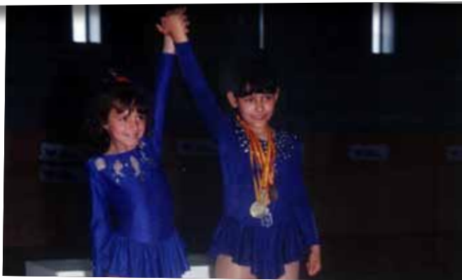
1992 CAMPIONAT D'ESPANYA ALEVI ROSA SANS