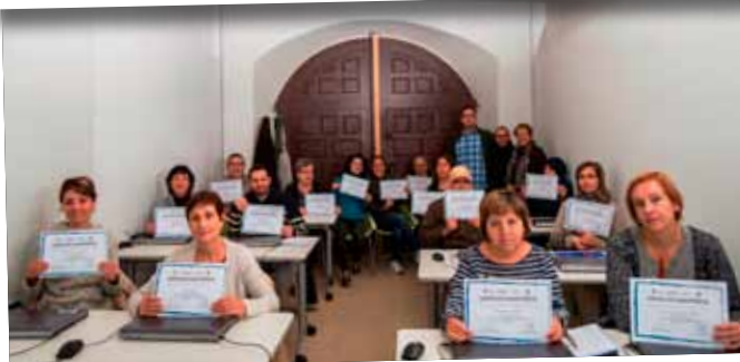
Entrega de diplomes del curs d'iniciació a la informàtica.