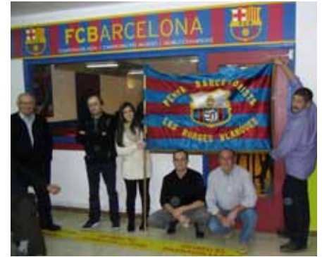
■ Responsables de la Penya Barcelonista al seu local.

Es va fundar l'any 1998 i està integrada per una desena de membres que cada any, als volts de Nadal, organitzen el Concurs popular de Pessebres, amb diferents categories en funció de les edats dels participants. Tots els que hi prenen part reben un diploma i un premi, a més de reconèixer les dues millors creacions de cada categoria, en un bonic acte a la Casa de la Cultura. A més, s'encarreguen de preparar amb cura i dedicació el Pessebre oficial de les Borges a l'entrada de l'Ajuntament. Durant la resta de l'any també organitzen exposicions de diorames molt elaborats, premien fora de concurs a les botigues amb motius nadalencs originals, i decoren equipaments com la Biblioteca o el Centre Cívic, amb naixements artístics i decoratius. ■