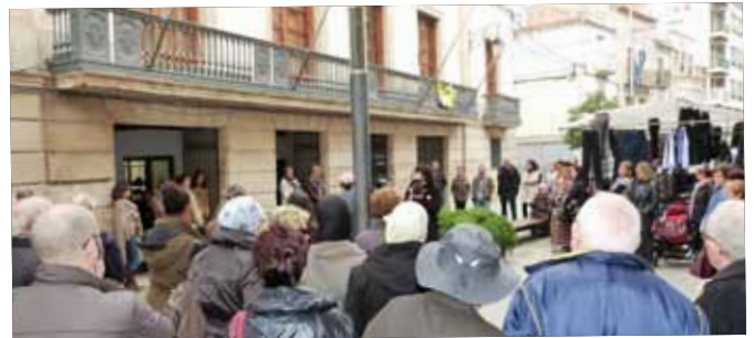
Dia Internacional per a l'eliminació de la violència envers les dones (25-11-2014)