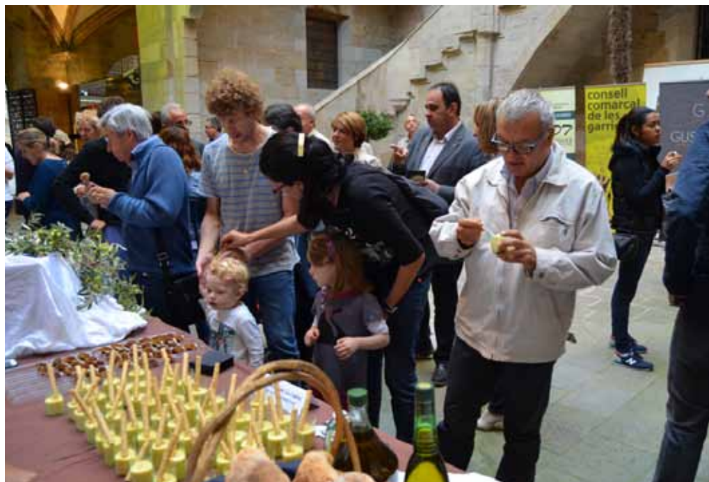
■ Presentació de la XX Mostra Gastronòmica a l'IEI

I amb la voluntat de millorar les oportunitats de futur per al jovent, el Consell ha col·laborat amb el Departament de Benestar Social i Família per oferir formació i pràctiques en restauració de productes de proximitat a 12 joves aturats de les Garrigues amb el