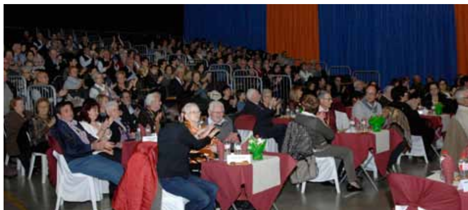
■ L'homenatge als octogenaris del 2014 a les Borges Blanques

L'Ajuntament de les Borges Blanques va homenatjar als seus padrins i padrines que enguany complien 80 anys, fent-los entrega d'una medalla i un diploma commemoratiu. A l'acte hi van assistir prop de 500 persones, entre amics i familiars.