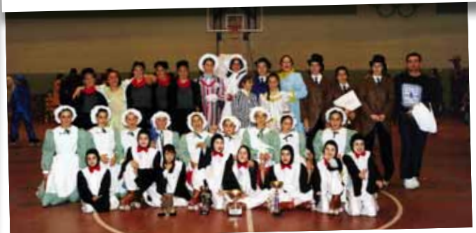
1996 FESTIVAL PROVINCIAL