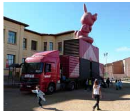
■ El MuMo a l'escola Joan XXIII.