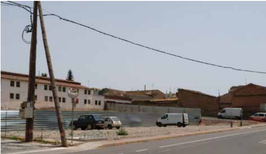
■ Solar de l'antiga caserna de la Guardia Civil a les Borges Blanques.

Fruit de l'auditoria comptable i de gestió que es va encarregar en relació al mandat anterior, el govern municipal va presentar un recurs contra una entitat bancària pels elevats costos que significava per les seves arques públiques la contractació d'una permuta financera.