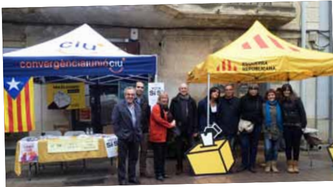
Campanya conjunta en favor del 9N al Mercat.