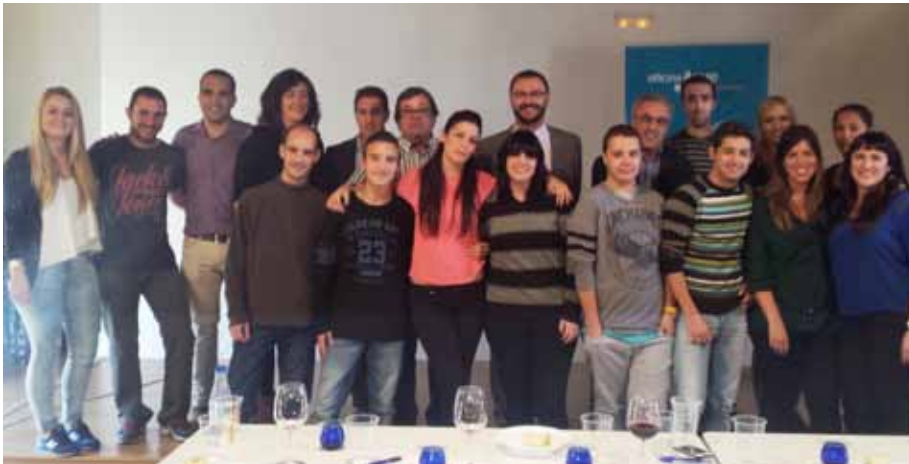
■ El grup d'assistents al progrma Fórmula Jove

L'Oficina Jove de les Garrigues està duent a terme per segon any un programa formatiu a la comarca destinat a la gent jove que té dificultats per entrar al món laboral. El seu objectiu principal és oferir una oportunitat per a la formació i millora de l'ocupabilitat de persones entre 16 i 24 anys, amb baixa qualificació i que no estudien ni treballen.