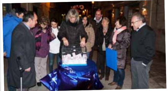
Primer sorteig dels vals de compra de 50 euros als comerços locals.