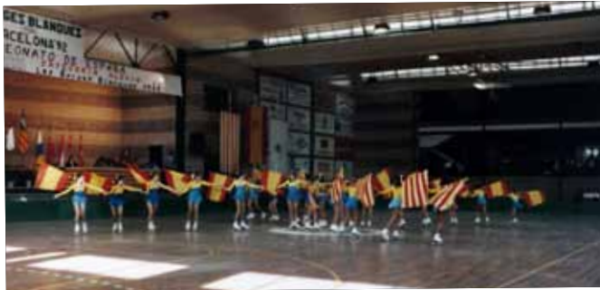
1989 EL CLUB ORGANITZA EL CAMPIONAT D'ESPANYA ALEVI

Butlletí d'informació municipal Desembre 2014 | Num. 08