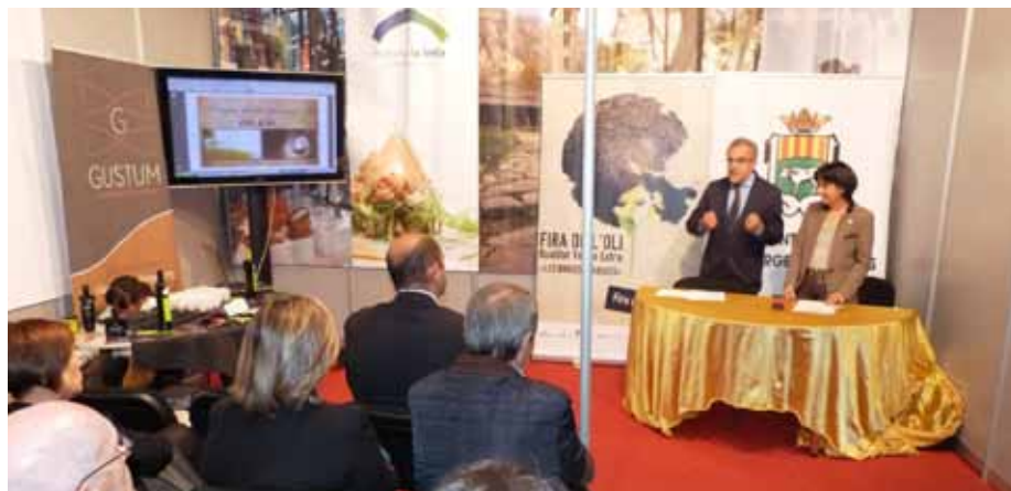
■ Presentació de la 52a Fira de l'oli i les Garrigues a Andorra.

La primera presentació s'ha fet a la 36a Fira d'Andorra la Vella, on a més s'ha signat un conveni de col·laboració per a la promoció tu-