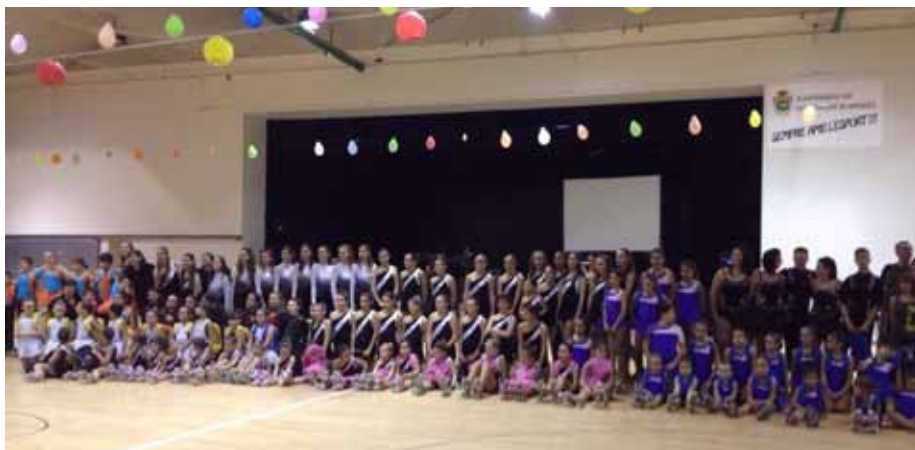
■ Celebració del 30 aniversari del Club Patí Borges