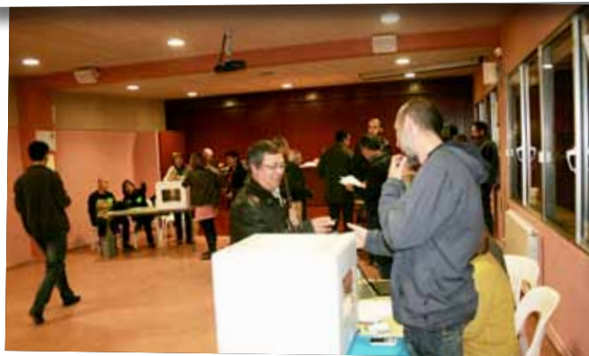
Procés de participació del 9 de novembre a les Borges.