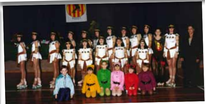
1998 FESTIVAL CLUB