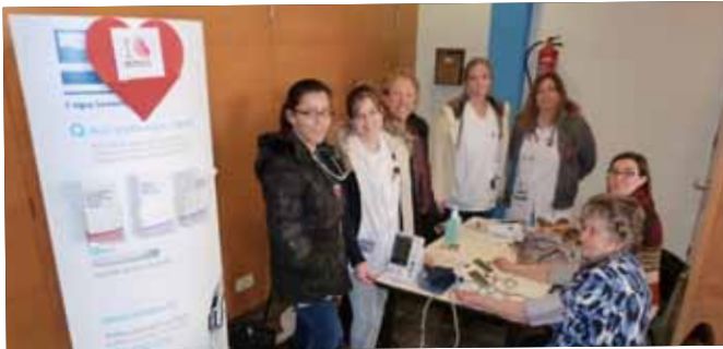
Prevençió cardiovascular del CAP de les Borges al Centre Cívic.