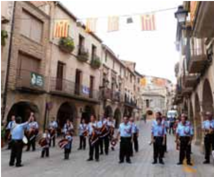
■ La Banda de Cornetes i Tambors actuant a la Festa Major.