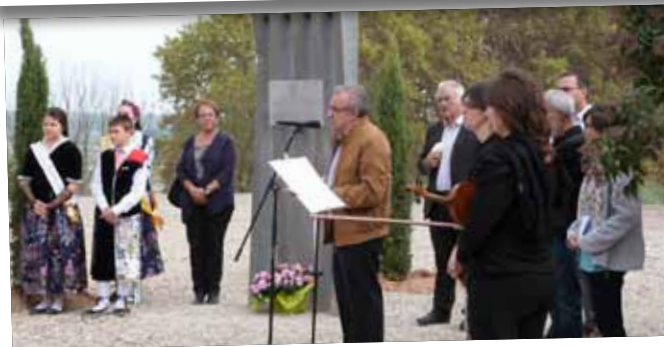
Inauguració de l'arranjament del Cementiri Vell.