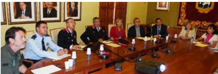
■ La Junta Local de Seguretat de finals d'octubre a les Borges.

La Junta Local de Seguretat de les Borges va presentar a l'octubre el balanç anual de les actuacions policials, en la que destaca una disminució dels fets coneguts, delictes i faltes, en un 17,5%. En el transcurs de la Junta també s'ha donat a conèixer que entre el període d'octubre de 2013 a setembre de 2014 s'han resolt un de cada tres delictes denunciats, i la disminució dels robatoris a l'interior de domicilis, d'empreses i en el món rural.