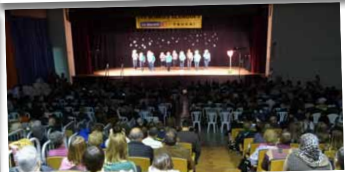
Festival d'entitats en benefici de La Marató de TV3 2014.