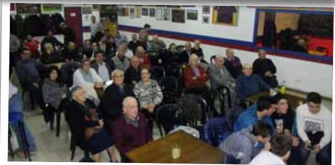
Membres de la Penya Barcelonista en un partit recent