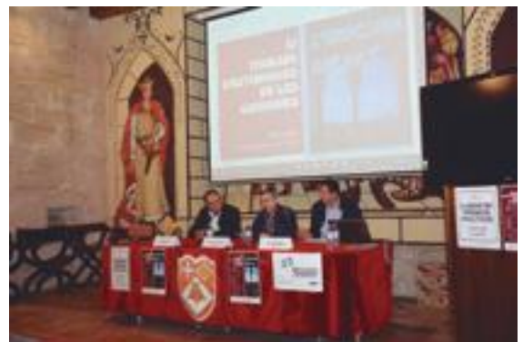
■ La Trobada d'Estudiosos de les Garrigues

I pel que fa a la promoció turística de la comarca, del 4 de novembre al 17 de desembre s'ha celebrat per 23è any consecutiu la Mostra Gastronòmica de les Garrigues , que ha comptat enguany amb la participació de nou restaurants de la comarca amb menús elaborats exclusivament per a l'ocasió i amb l'oli d'oliva verge extra i la fruita dolça com a protagonistes indiscutibles. ■