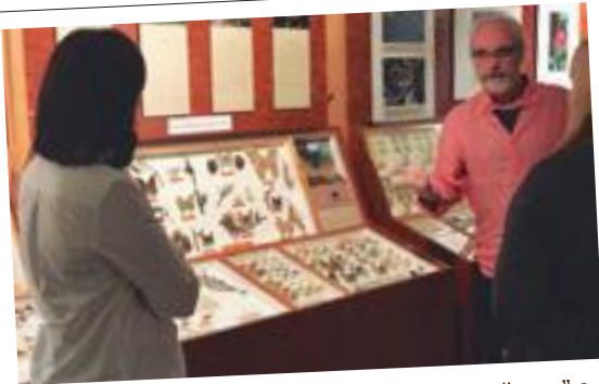
Inauguració de l'exposició "El món de les papallones" a les Borges

Butlletí d'informació municipal Desembre 2017 | Num. 18