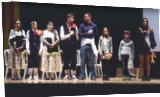
Els representants del pubillatge borgenc sortint i els proclamats diumenge