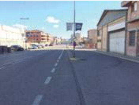
■ Imatge actual de l'Av. Francesc Macià