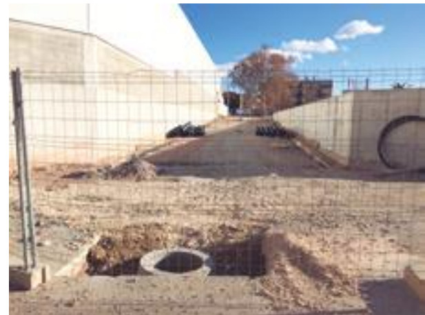
■ Els carrers Montserrat i Canal d'Urgell, que estan arrançant-se amb les obres del col·lector

- l'obra del vial d'accés a la part alta del poble, al carrer Castell alt, sota la Llar d'Infants del Col·legi Mare de Déu de Montserrat i darrere de l'Església parroquial. Cal tenir present que, tot i ser un camí de molta utilitat pels seus usuaris habituals, es troba en pèssim estat de conservació, amb laminació constant de la part exterior del coster, pel que suposava un perill evident que s'havia de solucionar amb urgència.