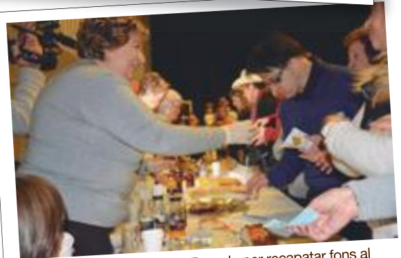
El berenar de les Dones La Rosada per recaptar fons al Festival ProMarató 2017 de les Borges