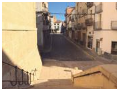
■ Els carrers Carnisseria i Santa Vedruna, a punt de ser arranjats

Finalment, en quant a subvencions a les entitats culturals, clubs esportius i altres associacions sense ànim de lucre, cal dir que mantindrem els mateixos imports que el 2017, ja que creiem amb la contribució inestimable del teixit de persones voluntàries i desinteressades que fomenten la cohesió social, la convivència amb valors, i a la vegada per ser els ambaixadors de les Borges en cada sortida que fan fora de la ciutat. ■