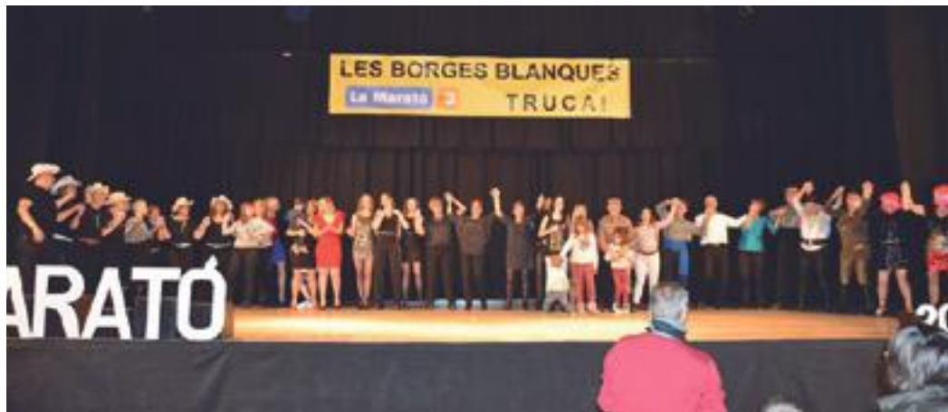
■ Alguns dels participants del Festival ProMarató 2017 de les Borges, cantant amb el públic la cançó 'Boig per tu' de Sau

D'aquesta manera, la capital de les Garrigues s'ha sumat un any més als actes solidaris programats arreu de Catalunya a favor de la Marató de TV3. Amb tot, cal recordar que a banda del festival, com es fa cada any, també hi ha hagut altres activitats benèfiques i bústies de recollida de donatius durant el mes de desembre i que continuaran fins a primers de gener, com en els partits de bàsquet, de Tennis Taula i de l'Escola de Futbol comarcal, així com al ball dels diumenges, a la Biblioteca Marquès d'Olivart, el Festival de l'Escola Joan XXIII, en el qual van participar les AMPES de l'Escola i de la Llar d'Infants Municipal, entre altres indrets. ■