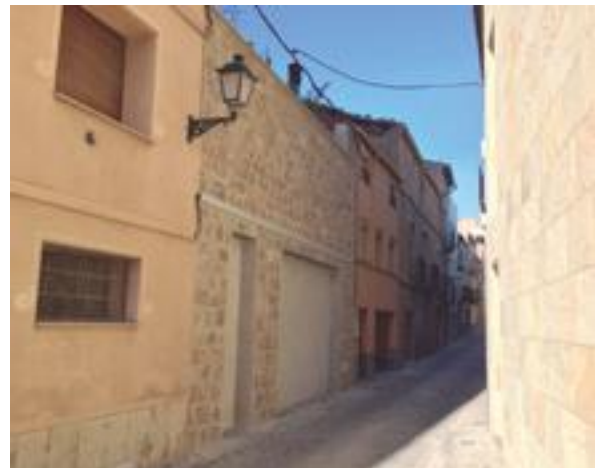
■ Una façana rehabilitada recentment al Centre Històric de les Borges

Finalment, es podran acollir a aquests ajuts les actuacions que contemplin la reparació de les parts d'obra en mal estat; decapar la totalitat de la façana; neteja de les parts de pedra; restauració singular d'elements escultòrics o tractaments ornamentals; reconstrucció o restitució d'elements deteriorats o desapareguts; pintura dels arrebossats de l'edifici; neteja i tractament adequat dels paraments petris o ceràmics i dels elements de tancament; neteja dels esgrafiats i de la serralleria i elements metàl·lics que formin part de la façana; i la retirada i recol·locació dels elements i/o instal·lacions que tenen incidència en el paisatge urbà.