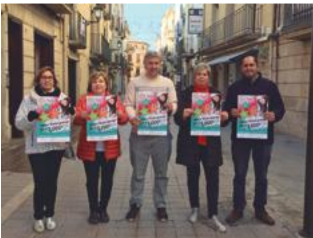
■ Els representants de l'Agrupació de Comerciants i el regidor de Promoció Econòmica presentant la campanya de Nadal 2017

La campanya ha estat organitzada per l'Agrupació de Comerciants de les Borges Blanques i hi ha col·laborat l'Ajuntament de les Borges, la Diputació de Lleida i la Generalitat de Catalunya. ■