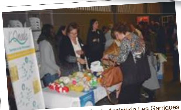
Les manualitats de la Residència Assitida Les Garrigues per recaptar fons al Festival ProMarató 2017 de les Borges