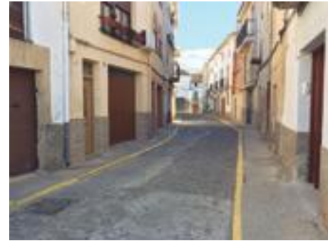
■ Aspecte actual del carrer la Placeta

Si afegim que tenim sol·licitades una quinzena d'obres d'arranjament de façanes al Centre Històric, també amb dret a subvenció, estem convençuts que en poc espai de poc temps, tindrem una remodelació significativa de la imatge del cor de la nostra ciutat.