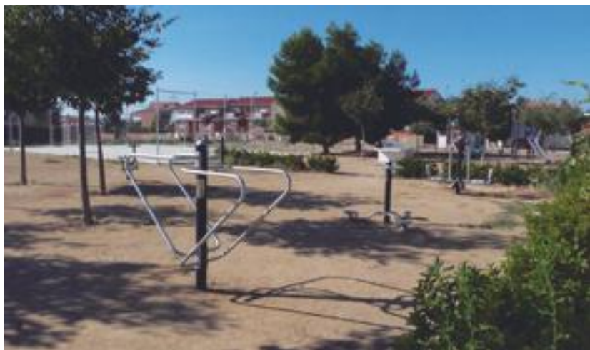
■ Els nous elements per a fer exercici físic instal·lats a les Borges Blanques

L'objectiu del projecte, valorat en 207.999,35 euros, IVA inclòs, és el de millorar l'eficiència energètica de la xarxa pública d'enllumenat i aconseguir un important estalvi energètic, així com la disminució de les emissions d'efecte hivernacle, reduint la contaminació lluminosa i corregint-ne els seus efectes perturbadors sobre els ecosiste-