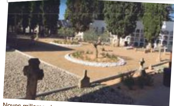
Noves millores al cementiri de les Borges per acollir les nombroses visites del Dia de Tots Sants