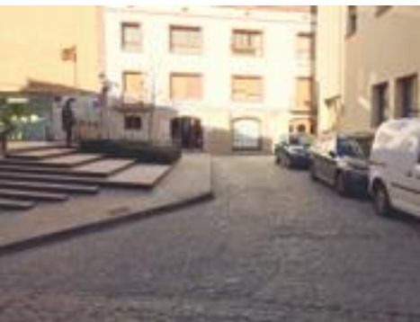
■ Els carrers Josep i Concepció Solé que es reformaran en breu