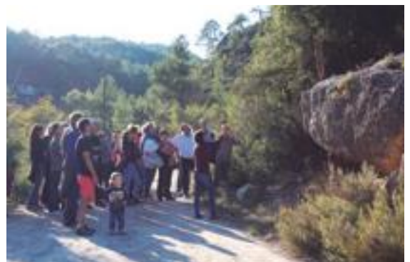
■ El Camí dels set sentits