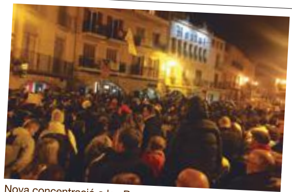
Nova concentració a les Borges per demanar la llibertat dels presos polítics del 08-11-2017