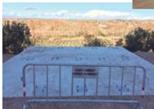
■ Els treballs de construcció del nou Mirador dels Pirineus i aspecte actual del Camí del Cementiri Vell