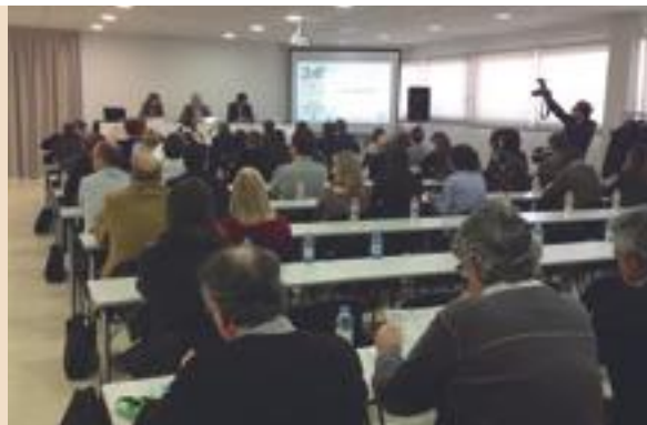
■ L'acte d'inauguració del 24è Congrés de Fires de Catalunya a les Borges Blanques