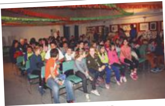
Els assistents a la 15a Festa de la Bibliocursa Novembre del 2017