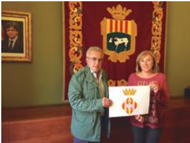
■ L'alcalde i la regidora de Governació amb el nou escut heràldic de les Borges Blanques, a la Sala de Plens

Així, segons Palau, l'adaptació de l'escut heràldic borgenc, coincidint amb el 300 aniversari de la independència administrativa del municipi respecte a la ciutat de Lleida s'ha fet per corregir algunes anomalies, començant per deixar d'utilitzar un escut que no s'adaptava a la normativa al respecte i que comptava amb la presència d'una vaca en lloc d'un bou o la corona superior, que no es correspondrien amb la història del municipi. D'aquesta manera s'ha reprès la modificació heràldica iniciada l'any 2000 que va quedar aturada arran d'unes al·legacions, ja que ara es compta amb un informe del Centre d'Estudis de les Garrigues que avala el canvi de l'escut i de la denominació històrica del consistori. ■