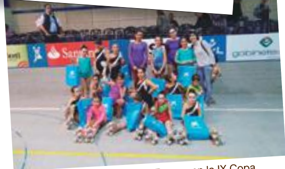
Les patinadores del Club Patí Borges en la IX Copa Alcoletge, celebrada el 28 i 29 d'octubre de 2017