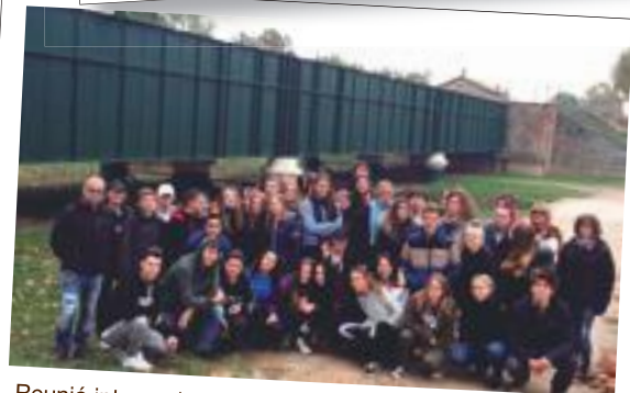
Reunió internacional del projecte Erasmus+ amb alumnes i professors de 5 països a l'INS Josep Vallverdú