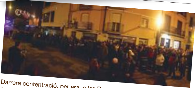
Darrera concentració, per ara, a les Borges demanant la llibertat dels presos polítics el dia 04-12-2017