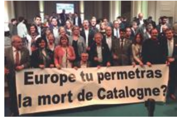
■ Acte dels 200 alcaldes a Brussel·les per a internacionalitzar la repressió de l'Estat a Catalunya

L'alcalde borgenc va defensar "els actes simbòlics estan molt bé, però són clarament insuficients per deixar ben palès el sentiment pacífic, democràtic i determinat de la majoria de catalanes i catalans amb poder disposar d'un futur millor, on es respectin els drets fonamentals, la justícia social, les llibertats i amb majors oportunitats de progrés sobretot per a les futures generacions. L'Estat espanyol no reaccionarà fins que els actes de condemna a la seva ofensiva antidemocràtica afectin la seva viabilitat econòmica i social". ■