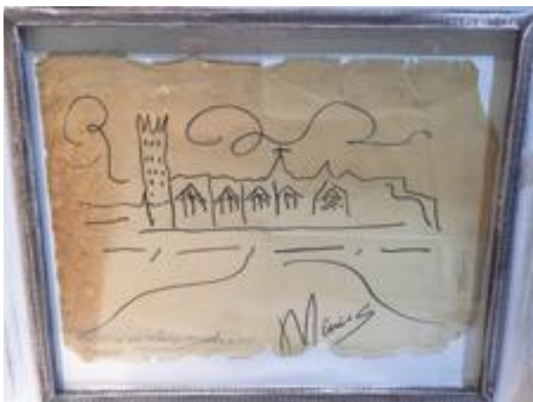
■ El dibuix inèdit de Màrius Torres localitzat a l'Espai Macià