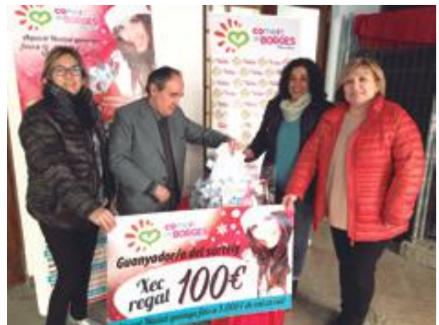
■ Un dels sorteigs de la campanya de Nadal 2017 de l'Agrupació de Comerciants de les Borges de