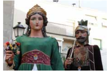
■ Ramon Berenguer IV i Peronella d'Aragó.

Fa més de 50 anys es va constituir a les Borges l'Associació Amics de Sant Salvador, una entitat creada per tal de garantir la conservació de l'ermita que porta el mateix nom. Aquest espai emblemàtic de les Borges, situat a la carretera en direcció a Cervià de les Garrigues, acull cada any diverses trobades populars, la més important de les quals és l'Aplec de Sant Salvador, que se celebra cada agost en honor del sant i que aplega gairebé mig miler de persones. Aquestencontre, organitzat per l'Associació d'Amics de Sant Salvador amb la col·laboració de la Parròquia de les Borges, compta amb actes com la celebració d'una missa, sardanes, el sopar de germanor i havaneres amb rom cremat. L'Associació Amics de Sant Salvador està formada per 10 socis que actualment, amb l'ajuda econòmica del consistori, s'encarreguen del manteniment de l'edifici i del seu entorn. ■