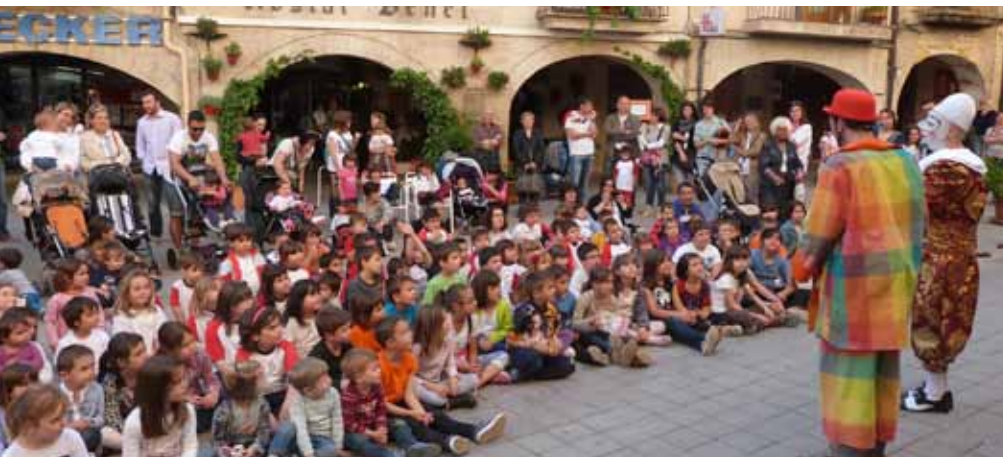
■ Espectacle "Un Sant Jordi de Nassos" a la plaça, a càrrec dels pallassos de la companyia Jomeloguisjomelocom.

Centenars de veïns i veïnes de les Borges han sortit al carrer durant la diada de Sant Jordi per gaudir de les diferents propostes culturals i de les tradicionals parades de llibres i flors, que s'han combinat amb els diferents estands d'entitats i de grups escolars. Les activitats paral·leles ja es van començar a gestar la nit abans, ja que la biblioteca Marquès d'Olivart va programar el recital poètic "21 x XXI, poetes lleidatans contemporanis", du-