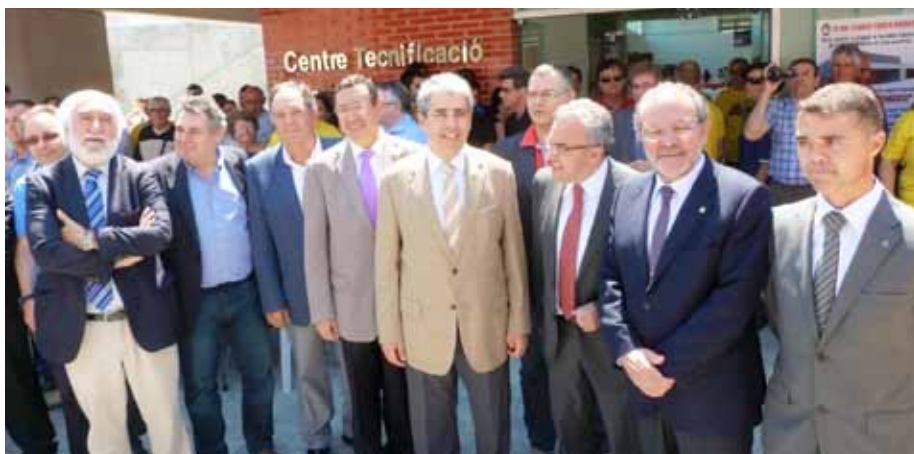
■ Els representants institucionals a l'arribada al nou Centre de Tennis Taula

Prop de 400 persones, la majoria actuals jugadors, ex jugadors, membres del cos tècnic i afició del CTT Borges, van voler ser presents a la inauguració del nou Centre de Tecnificació de Tennis Taula, que després d'un any d'obres ja és una realitat. L'acte va comptar amb la presència de nombroses personalitats polítiques així com del conseller Francesc Homs, encarregat d'inaugurar un equipament que s'ha pogut dur a terme gràcies al finançament de la Gene-