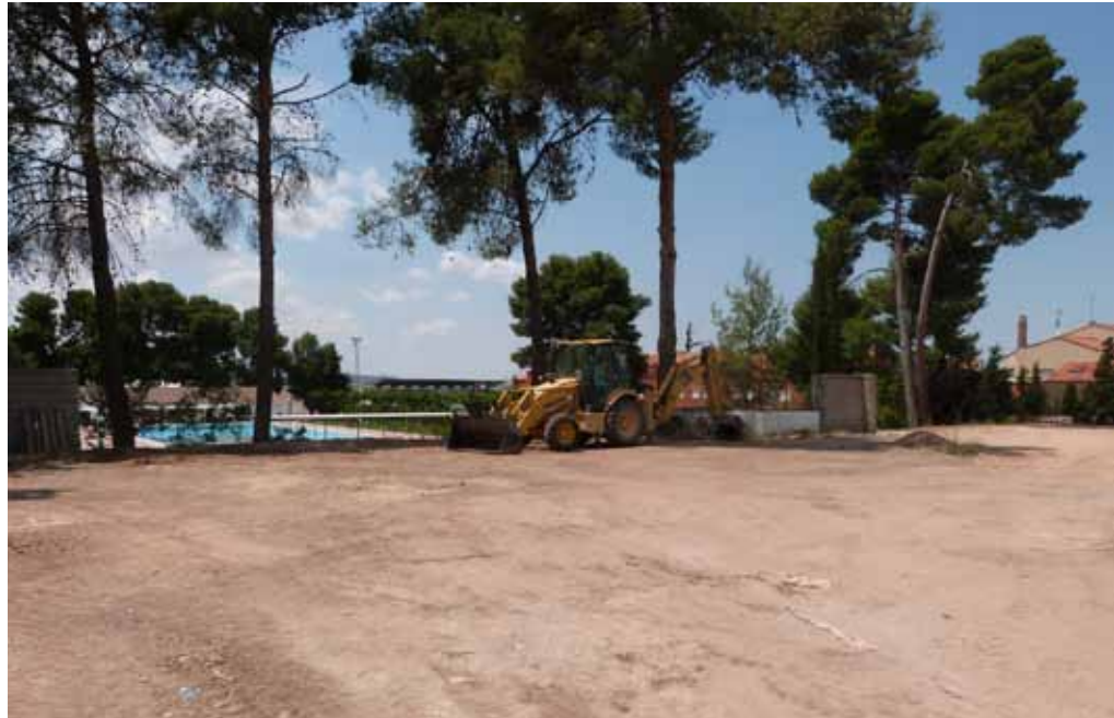
■ Les obres de la nova zona lúdica i esportiva situada al carrer Maria Codina ja han començat.

Tres anys després de l'inici d'aquest mandat, les Borges continua amb la seva particular transformació urbana a través de la que tots els ciutadans podran gaudir de diferents espais adaptats a les seves necessitats i amb el quals la ciutat esdevindrà més moderna i segura. Actualment s'estan tirant endavant dos dels projectes considerats prioritaris per l'equip de govern, com són la creació d'una zona d'esbarjo situada al carrer Maria Codina, entre el nou Centre de Tecnificació de Tennis Taula i les piscines municipals, i l'adequació de la plaça de l'Església, al carrer Abadia. Aquesta última actuació, que està previst que comenci durant aquesta tardor, compta amb un pressupost de 65.000 euros i està subvencionada per la Generalitat de Catalunya. L'obra comportarà fer noves les escales del temple i la construcció d'una rampa que comunicarà el casc antic de les Borges amb la part alta, on hi ha la Llar d'Infants del col·legi Mare de Déu de Montserrat. Amb aquesta actuació el consistori proporcionarà un itinerari més còmode, amb una rampa més suau, per accedir a aquesta zona de la ciutat. L'actuació també inclou la creació d'una nova pla-