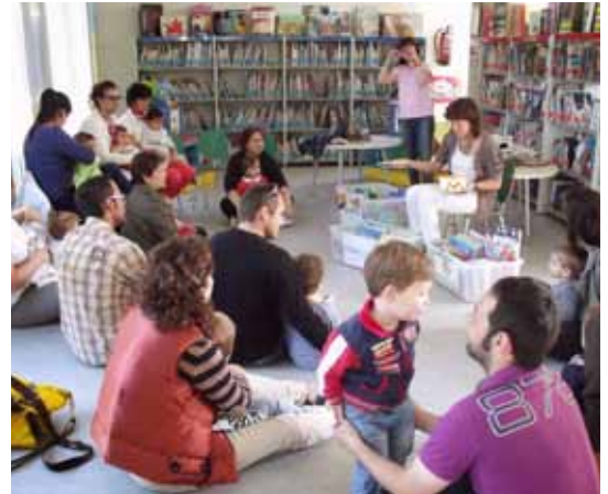
■ Sessió de contes per als alumnes de la llar d'infants de l'escola Mare de Déu de Montserrat.

Després d'un intens període escolar amb la trobada de sales i biblioteques de la comarca, visites d'alumnes i les diferents sessions dels grups de lectura, la biblioteca Marquès d'Olivart us proposa un estiu amb diverses activitats: