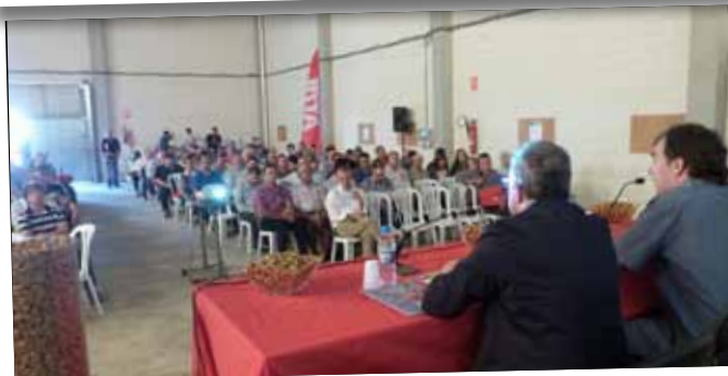
La VI Jornada tècnica sobre l'ametller va aplegar més de 300 participants d'arreu del món