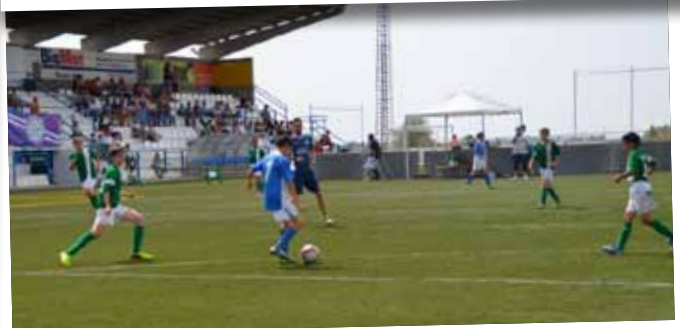
La Garrigues Cup aplega més de 200 joves futbolistes