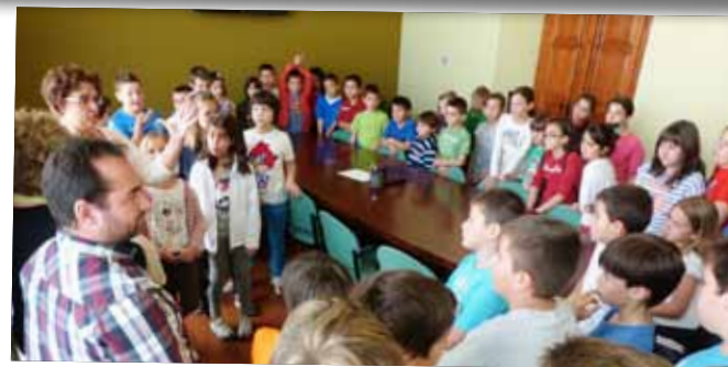
Els escolars del col·legi Mare de Déu de Montserrat visiten l'Ajuntament