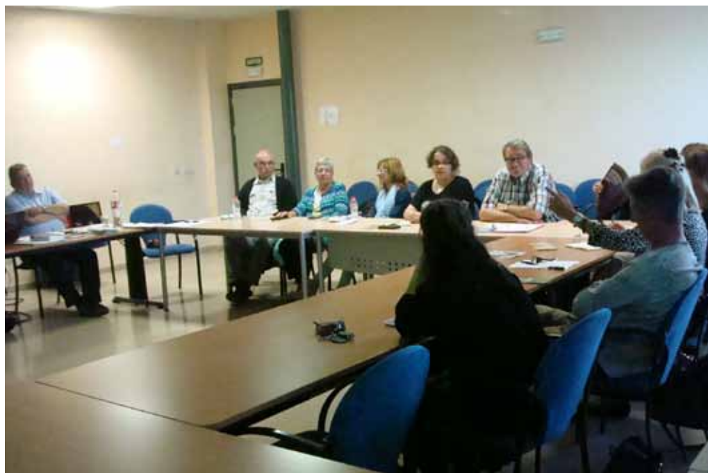
■ Reunió dels agents turístics de la comarca a la sala de plens del Consell Comarcal.

Així mateix, el Consell Comarcal, amb Ara Lleida i Igers Lleida, ha organitzat el 1r Concurs d'Instagram "Paisatge, gastronomia i cultura de les Garrigues" , del 26 de març al 31 de maig. El 20 de juny s'entregarà un lot de productes de la comarca a les tres millors fotografies i es farà una exposició a la