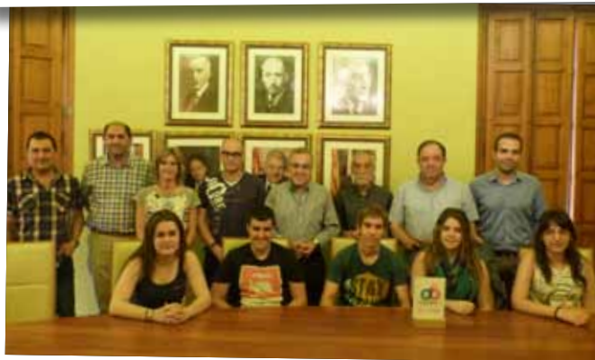
El consistori rep els alumnes de l'INS Josep Vallverdú premiats per la creació d'una App sobre el turisme garriguenc