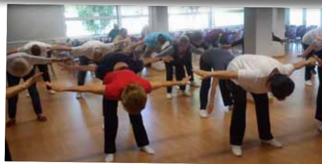
III Jornades de Salut i Diabetis al Casal de la Gent Gran