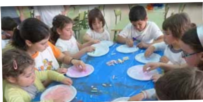
Esplai de Setmana Santa organitzat per Apassomi