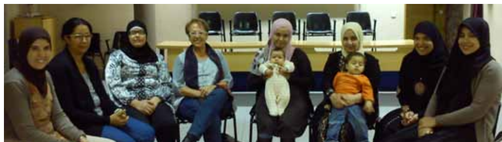
■ Les trobades han tingut lloc durant dos dies a la setmana al Centre Cívic.

Un total de 20 dones musulmanes han participat al llarg d'aquest curs escolar en el projecte de voluntariat impulsat per la regidoria de Benestar Social i Família i que té com a objectiu ensenyar drets i deures als nouvinguts així com donar-los les pautes perquè siguin autosuficients, incidint sobretot en l'aprenentatge del català. La proposta, que va arrencar amb 5 participants, compta ara amb una vintena de dones que durant dos dies a la setmana han realitzat trobades amb monitores, durant les quals han treballat diferents aspectes en benefici de la seva integració social. Han après a desenvolupar-se en el seu dia a dia amb tasques com cosir, anar al mercat i fer manualitats. També han pres part en jornades temàtiques pròpies de la cultura catalana, com la castanyada, Nadal i