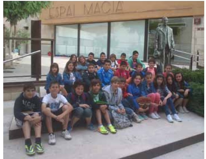
■ Alumnes del col·legi Mare de Déu de Montserrat a l'equipament cultural de les Borges.