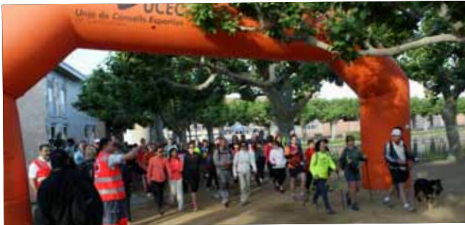
Més d'un centenar de participants a la 1 a Marxa de l'Or de les Garrigues