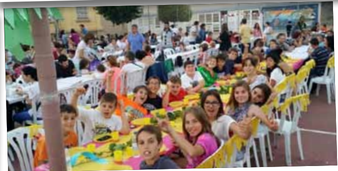
Festa de final de curs a l'escola Joan XXIII