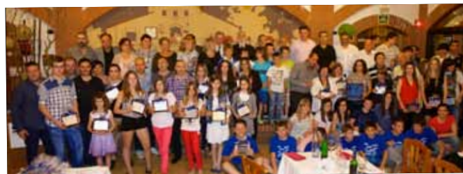
La Festa de l'esport arriba a la 25ª edició