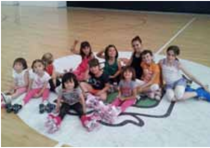
■ Joves patinadores del Club Patí Borges.