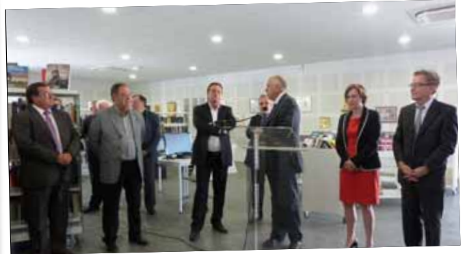
Les Borges inaugura un espai de promoció del territori a Toluges