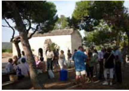
■ Aplec de Sant Salvador a l'ermita.

El Club Patí Borges és una entitat esportiva formada per una quarantena de nenes i joves que van des dels 3 anys d'edat i fins als poc mes de vint. La principal activitat del club es basa en la formació de les seves integrants, encara que també dóna importància a la competició a través de la participació en diferents campionats d'iniciació, certificats i festivals de clubs a mode d'exhibició. El Club Patí Borges compta amb integrants de totes les categories i també amb un equip de Grup Shows, format per noies d'entre 11 i 14 anys. L'entitat celebrarà aquest proper mes de novembre el seu 30è aniversari, pel que ja està preparant una gran festa que comptarà amb diferents actuacions i amb un canvi de mallot. ■