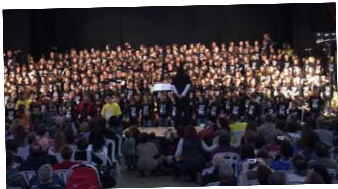
Més de 450 infants a la Trobada d'Escoles de música de Lleida