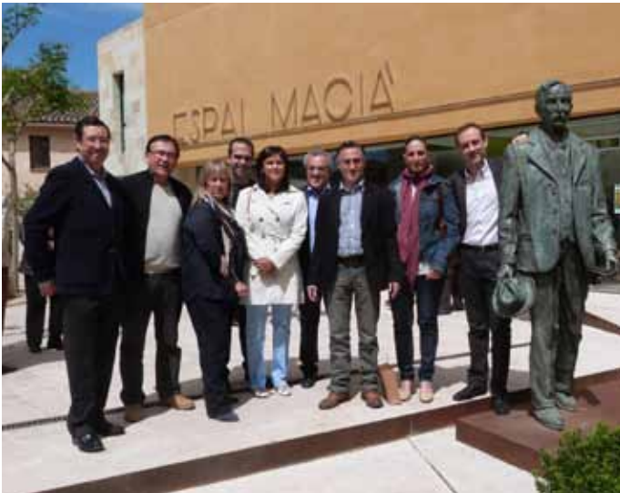
■ L'economista i eurodiputat Ramon Tremosa durant la visita a l'Espai Macià.