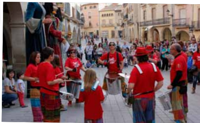
Actuacions al carrer durant el primer certamen FirEmocions