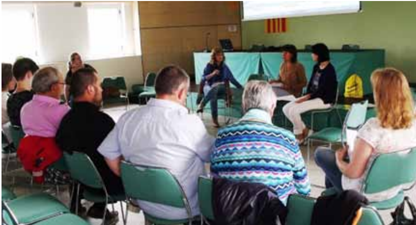
■ 6a Trobada de biblioteques de les Garrigues, amb representants de 8 municipis de la comarca.