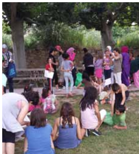
■ Acte de cloenda del curs del Centre Obert, amb un berenar a la Font Vella.

Des de fa quatre anys, el Centre Obert de les Borges obre les seves portes als infants d'entre 6 i 12 anys per tal d'oferir-los un espai de suport bàsic que facilita el seu desenvolupament i, alhora, pretén compensar les deficiències socioeducatives. Durant aquest curs 2013/2014, a més de les accions diàries de suport escolar i de treball d'hàbits, s'han desenvolupat activitats de caire lúdico-educatiu com ara sortides i visites al territori, projectes d'intercanvi generacional amb avis, tallers de manipulació, jocs i dinàmiques participatives i celebració de les tradicions. ■