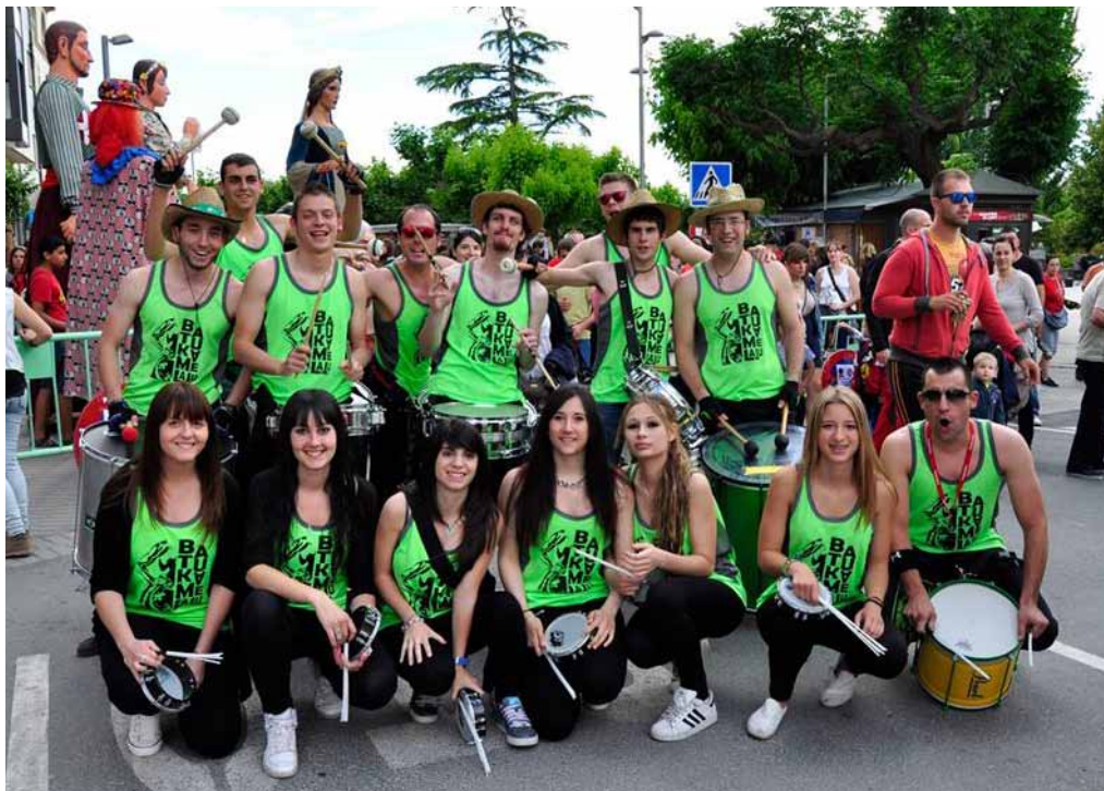
■ El grup Batukamelatu va animar la cercavila pels carrers del poble durant la Festa del Pas de l'Equador.

La Festa del Pas de l'Equador va aplegar unes 400 persones el passat 31 de maig i va comptar amb el repic de campanes a càrrec de l'Escola de Campaners de les Borges Blanques, una animada cercavila amb gegants i grallers de diversos pobles de les Garrigues, la sortida dels gegants, una tarda de jocs, gresca i berenar per als més petits, els correfocs, el ball de tarda a la placeta del Terrall i una