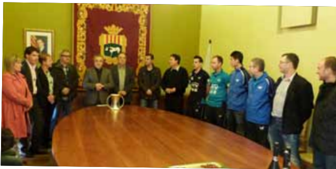
Recepció als campions de la Copa del Rei de Tennis Taula