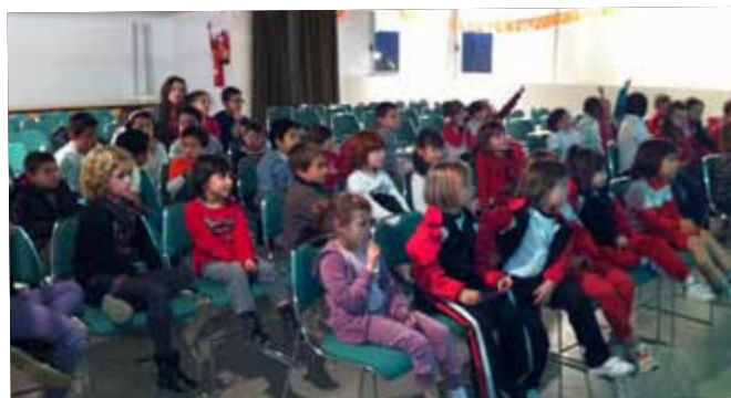
Contacontes a la Biblioteca en motiu del seu Xè aniversari