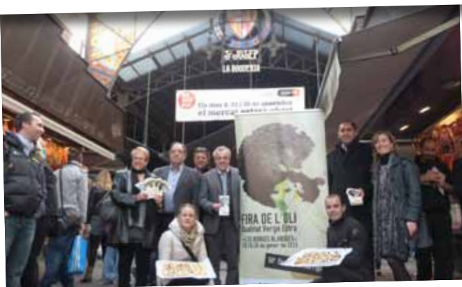
Promoció de la Fira al Mercat de la Boqueria