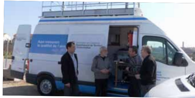
Estació mòbil ambiental