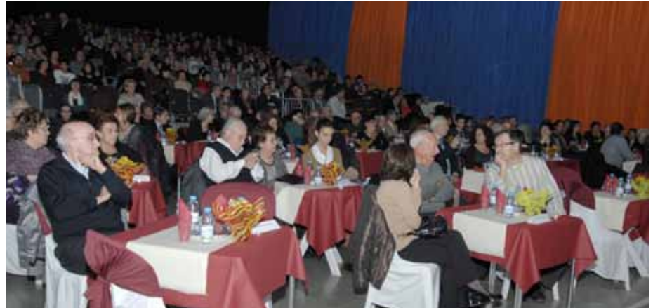
■ Homenatge als octogenaris al Pavelló de l'Oli

La solidaritat ha estat la gran protagonista dels actes organitzats aquest darrer any per la regidoria de Benestar social. D'una banda la ja tradicional participació en la Marató de TV3, enguany dedicada a la lluita contra el càncer. Entitats, associacions, centres educatius i ciutadans de les Borges es van bolcar en aquesta cita solidària que va aconseguir recaptar més de 7.500 euros. Un altre dels actes més destacats i amb més tradició a la ciutat és l'homenatge als octogenaris. Unes 600 persones entre familiars, amics i autoritats es van aplegar al Pavelló de