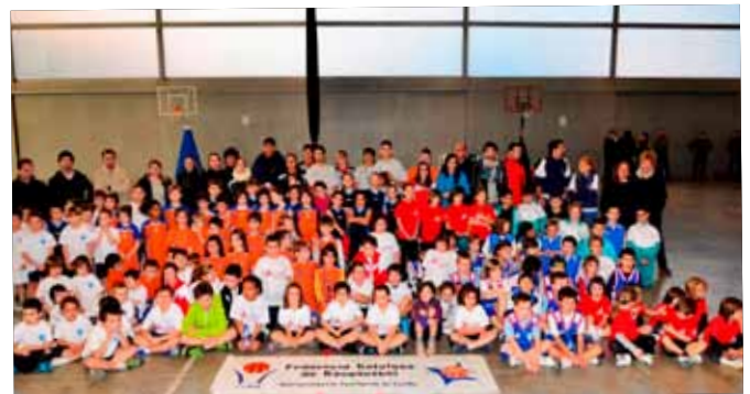
Trobada de bàsquet (03-02-2013)