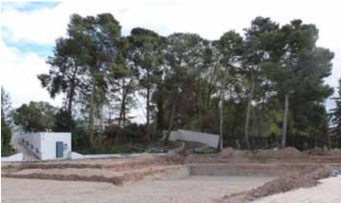
■ Construcció de la nova piscina, al costat de l'actual

Un dels projectes que més ciutadans beneficiarà és la construcció de la nova piscina descoberta, que farà que les Borges deixi de ser una de les poques capitals de comarca amb una sola piscina. El nou equipament s'està construint des de mitjans de març a tocar de l'actual piscina i del futur Centre de Tecnificació de Tennis Taula, i té un cost total de 244.405,76 euros, dels quals 117.000 estan subvencionats pel Pla Únic d'Obres i Serveis de Catalunya (PUOSC) i 114.000 per la Diputació de Lleida. El 5% restant anirà a càrrec l'Ajuntament de les Borges. El nou equipament, que podran utilitzar els menors de 14 anys i que comptarà amb una zona per a infants, estarà llest a principis de juny. El projecte també inclou la creació d'una zona d'ombra. La nova piscina, de 326 m 2 , tindrà dues zones: una per als més menuts, amb una fondària màxima de 40 centímetres, i l'altra que arribarà fins als 1,20 metres. ■