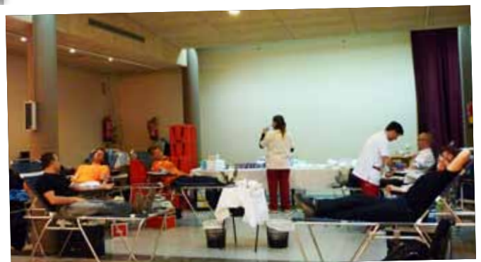
Marató de donació de Sang