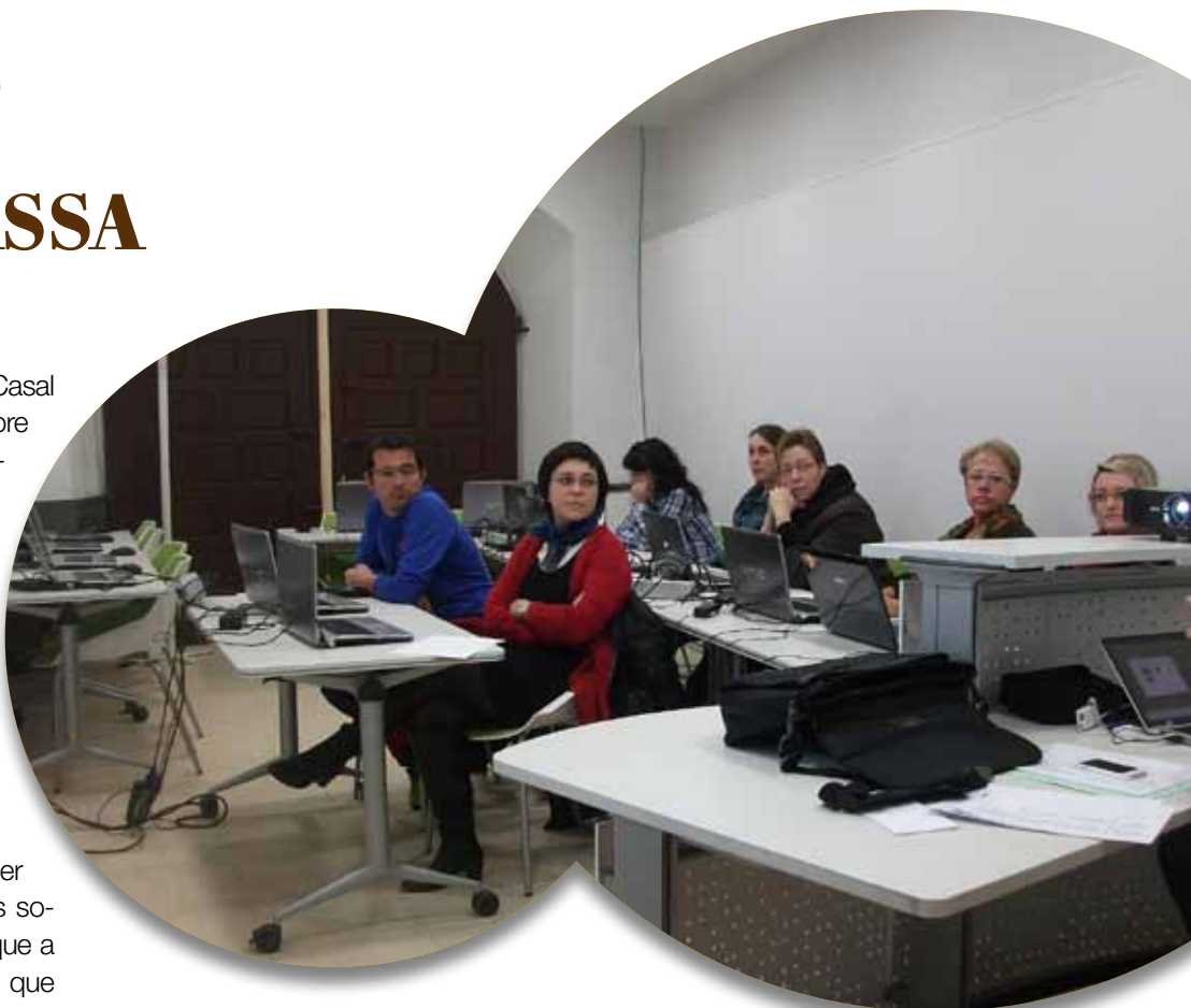
■ Curs de xarxes socials a la nova aula

El centre TIC La Borrassa, ubicat al Casal Marino, on s'hi va traslladar l'octubre de 2011, comparteix espai amb altres serveis municipals de les Borges com l'Oficina Jove, a més d'entitats i associacions locals com l'esplai Apassomi, l'Ateneu Popular Garriguenc, la revista Terrall i la colla sardanista Brut Natura. Al llarg d'aquest temps La Borrassa ha estat escenari de desenes de cursos gratuïts relacionats amb les tecnologies de la informació i, més recentment, per buscar feina a través de les xarxes socials, amb l'objectiu d'aconseguir que a les Borges no hi hagi cap col·lectiu que no tingui accés a la informàtica.