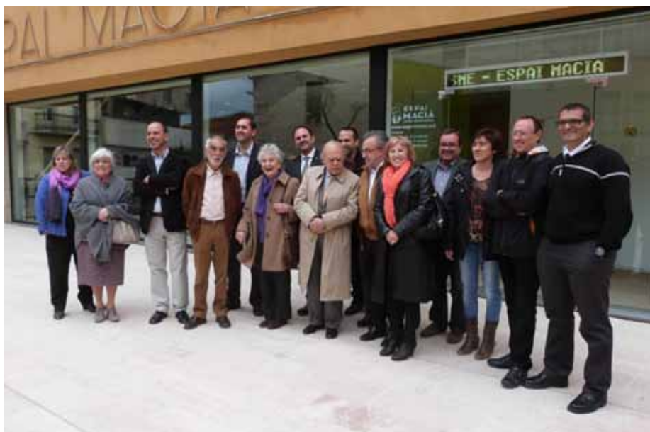
■ Visita de Jordi Pujol i Marta Ferrussola a l'Espai Macià

El fons compta amb fotografies inèdites de principis del segle XX a les Borges, i amb estris i documents personals del mateix expresident de la Generalitat de Catalunya. El més recent, un projecte d'enginyeria inèdit de Macià per crear un camí veinal a l'estació de ferrocarril Lleida-Tarragona de les Borges. L'Espai Macià també ha rebut en donació el fons de l'Orfeó Borgenc i mostra des del passat octubre els gairebé 500 números publicats de la revista satírica 'Cu-Cut', uns exemplars adquirits a través de la regidoria de Cultura de l'Ajuntament.