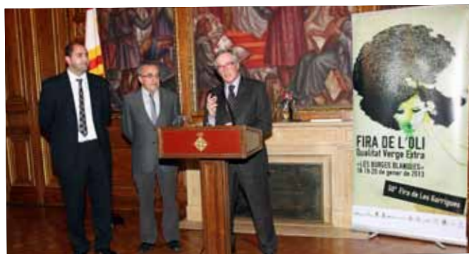
Presentació de la Fira a l'Ajuntament de Barcelona amb l'alcalde Xavier Trias