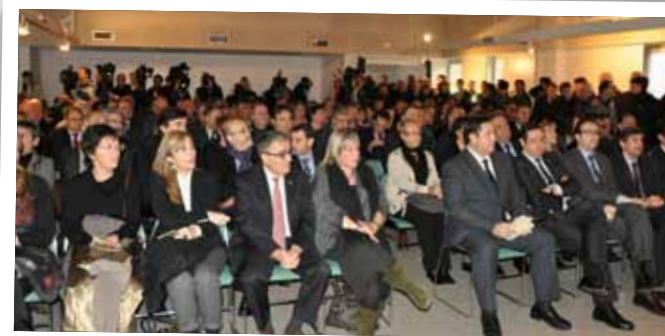
Acte d'inauguració de la Fira a la Casa de la Cultura