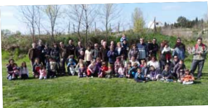
Plantada d'espècies autòctones a la Font Vella el dia de l'arbre