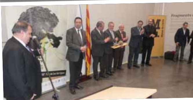
Agermanament amb l'Aplec del Caragol, a la presentació al Museu de Lleida