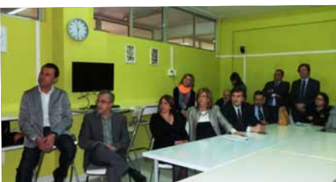
Inauguració nova aula tecnològica INS Josep Vallverdú