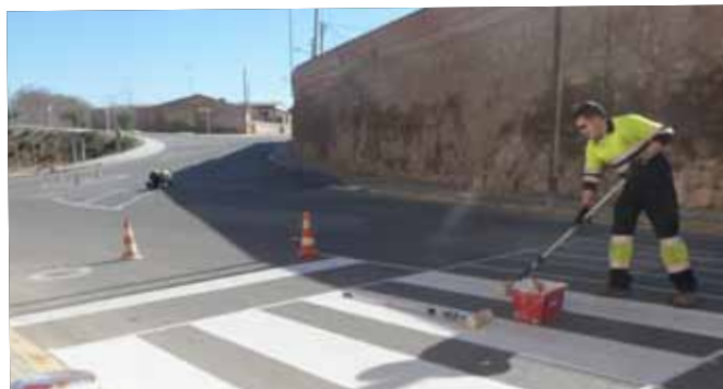
Nou pas de vianants vora l'estació de trens