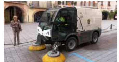
■ Nova adquisició per al servei de neteja

L'Ajuntament ha adquirit un nou vehicle per fer la neteja dels carrers. Es tracta d'un AUSA B200H, un vehicle híbrid fabricat a Manresa, catalogat amb la màxima certificació ecològica europea PM10, que garanteix que no fa pols ni contamina, amb 2.000 litres de capacitat, que funciona amb tecnologia TDI de baix consum i amb bateries elèctriques. La màquina ha costat 86.500 euros, finançats en gran part per la Diputació de Lleida, i permetrà al consistori estalviar-se la contractació de serveis de neteja externs, cada vegada que té lloc alguna gran activitat al carrer.