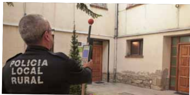
Mesurament de les ones electromagnètiques de les Borges