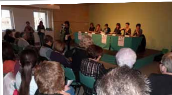
Dia de la Dona a la Casa de la Cultura