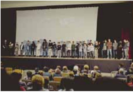
■ Presentació d'ARTS25400