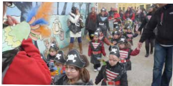
Carnestoltes a la Llar d'Infants