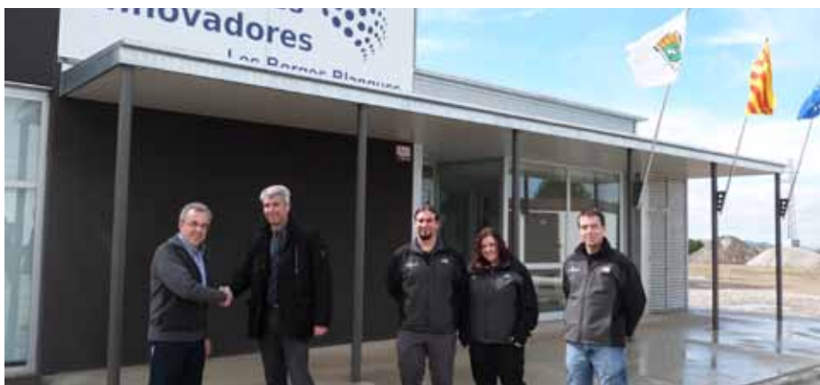
■ Arribada de la primera empresa al CEI Borges

La capital de les Garrigues compta des de fa uns mesos amb el Centre d'Empreses Innovadores (CEI) de les Borges, un centre ubicat a l'Avinguda Francesc Macià que neix amb l'objectiu d'afavorir la creació i incubació d'empreses innovadores i de les que ja existeixen i es volen implantar al centre. L'espai forma part de la Xarxa de Centres d'Empreses Innovadores de Lleida.