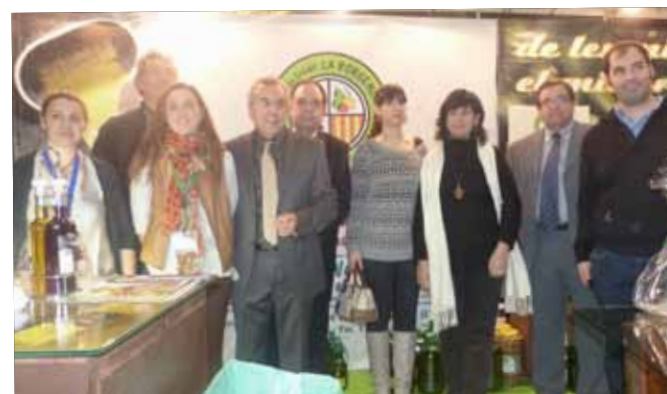
Visita de la família Santamaria, del restaurant Can Fabes