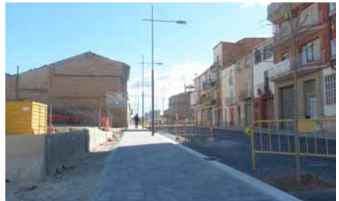
■ Obres de millora i adequació al Raval del Carme

Una altra de les accions que més contribuirà a millorar el municipi són les obres de millora i urbanització de l'antiga carretera N-240 al seu pas per les Borges.