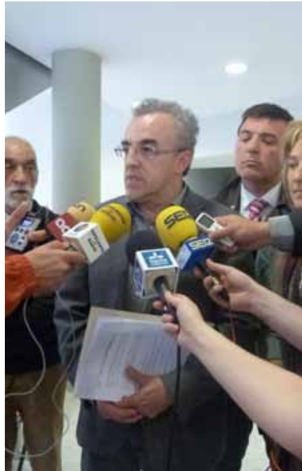
■ Atenció als mitjans de comunicació a la Fiscalia de Lleida

El consistori va al·legar que creia que l'empresa estava infringint la llei pel que fa a les emissions de fums i olors, i també va denunciar l'abocament d'oleïcs detectat el passat mes de març per la Policia Local, en una zona propera a l'empresa dedicada a l'extracció de la pinyola, motiu pel qual el consistori va obrir diligències prèvies. D'altra ban-