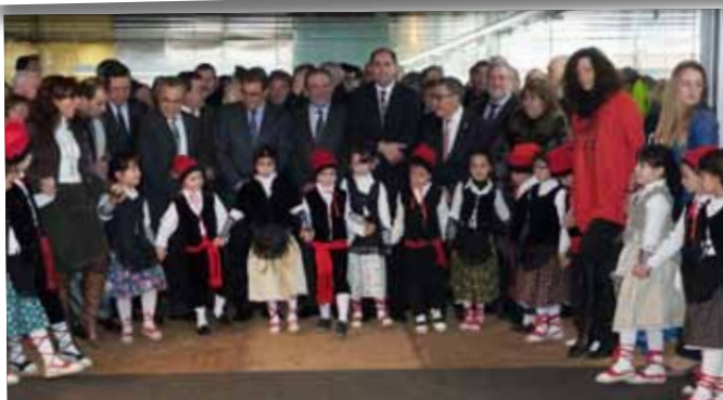
Inauguració de la Fira, amb autoritats i infants