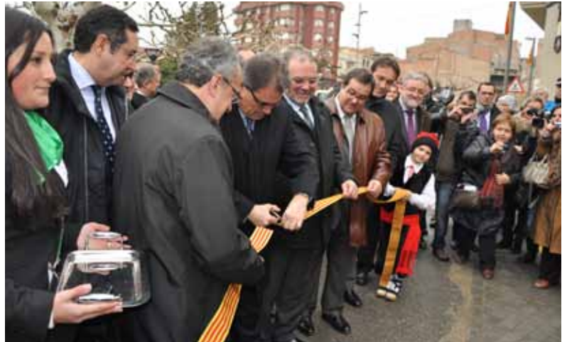
■ Inauguració de la Fira a càrrec del president Artur Mas