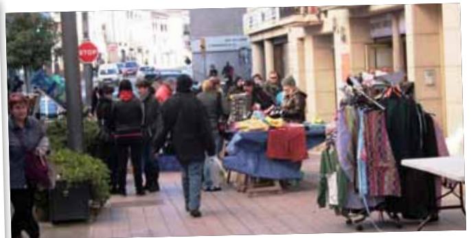
Mercat Rebaixes de febrer