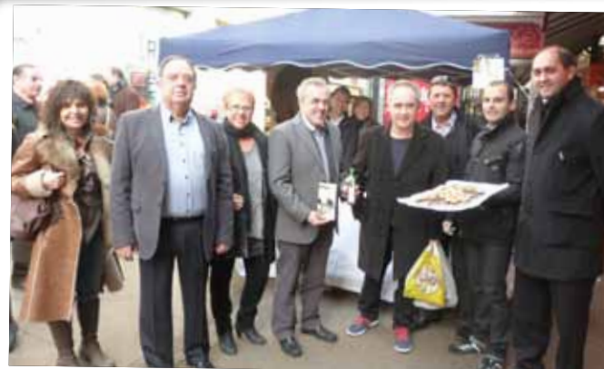
Acte de presentació a Barcelona amb el xef Ferran Adrià