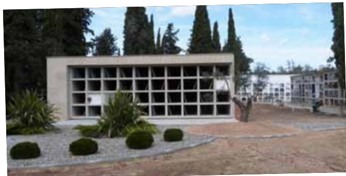
Ampliació i millora del cementiri