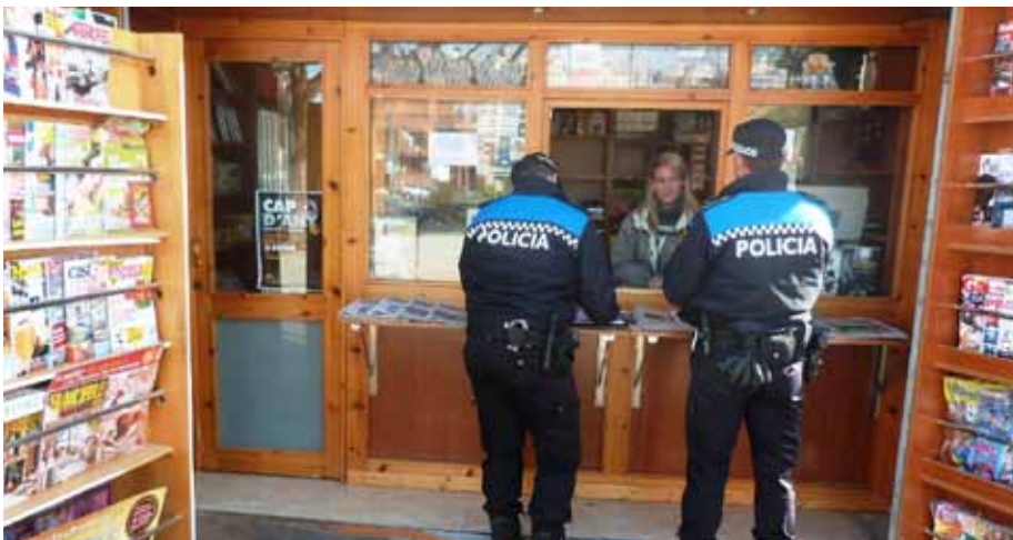
■ Recollida de dades en un dels comerços del municipi

L'any va començar amb una nova iniciativa en matèria de seguretat: l'inici de la campanya de proximitat de la Policia Local amb els comerços de les Borges. Es tracta d'una iniciativa pionera, que pretén recollir les dades de contacte de tots els propietaris dels establiments comercials de les Borges, que voluntàriament les vulguin facilitar, per localitzar-los en el menor espai de temps possible si hi ha alguna incidència o salta l'alarma del seu negoci. A més, també se'ls podran facilitar aquelles informacions que puguin ser del seu interès, com la presència de delinqüents habituals, la circulació de mo-