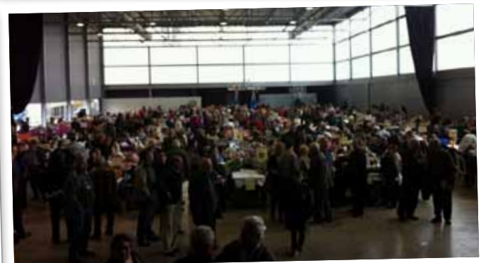
Trobada de puntaires al Pavelló de l'Oli