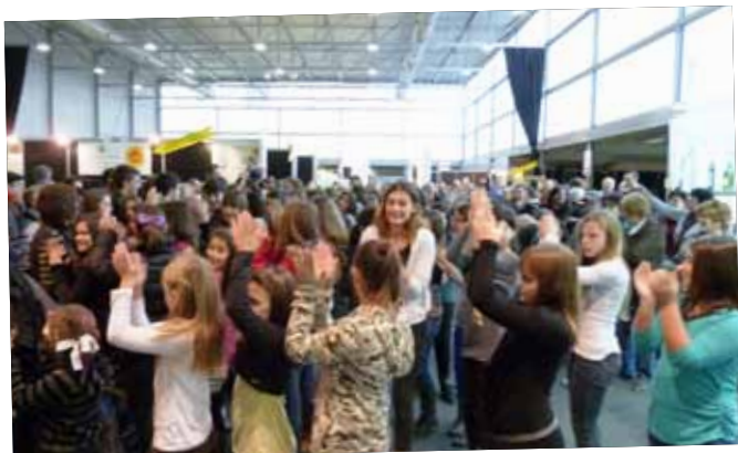
Flashmob dels infants de la comarca