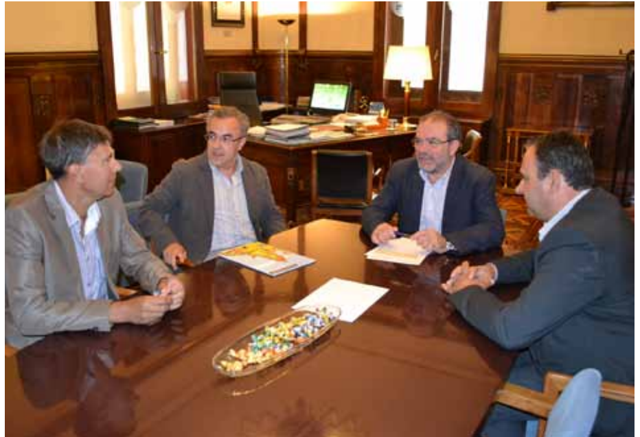
■ Reunió dels alcaldes de les Borges, Juneda i Torregrossa amb el president de la Diputació per reclamar solucions a la N-240

Un dels grans reptes de la comarca és posar solució a la sinistralitat de la carretera N-240. De moment, i gràcies a les reunions amb representants de diverses administracions, com la subdelegada del