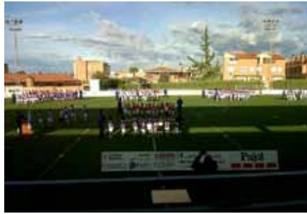
■ Inici de la temporada esportiva