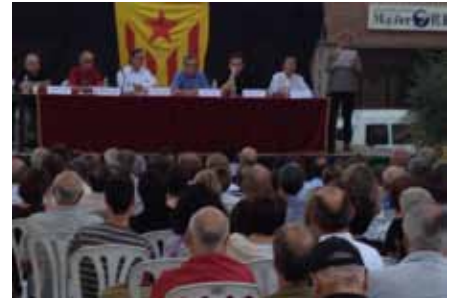
■ Acte reivindicatiu a la plaça de la Independència

Un total de 15 equips, 225 jugadors i 25 monitors formen part durant aquesta temporada 2012-2013 de l'Escola Comarcal de Futbol les Garrigues, una de les primeres que es van crear a Lleida i que cada any compta amb més alumnes de tota la comarca i del seu voltant. Tots ells, amb edats compreses entre els 4 i els 18 anys, reben formació esportiva i en valors com el companyerisme, la solidaritat, el joc net i l'esportivitat. Els membres del club, un equip de babies, dos pre-benjamins, dos benjamins, tres alevins, dos infantils, dos cadets, un juvenil i dos equips femenins, juguen i entrenen al Camp Municipal d'Esports de les Borges. L'Escola Comarcal de Futbol les Garrigues compta amb una web on es poden seguir tots els seus progressos: www.eflesgarrigues.com . ■