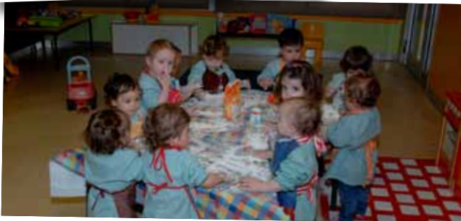
Els infants de la Llar aprenen a fer Mones de Pasqua (25-03-2015)