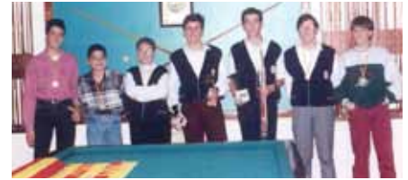
■ Club Billar Borges

Quan és temporada, es dediquen a la caça menor de la perdiu, el conill, la guineu i la garsa, i són els encarregats de gestionar el vedat de caça municipal, de 5.400 hectàrees de regadiu i secà, separades per l'AVE, l'AP-2, la N-240 i el Canal Segarra-Garrigues; on a més dels socis també permeten la pràctica cinegètica a una desena de forasters. ■