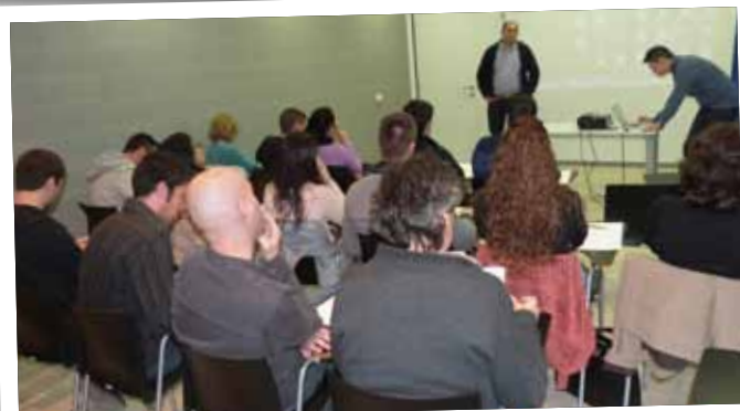
Càpsula formativa per a emprenedors al CEI de les Borges