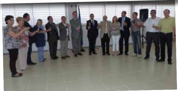
Potenciem l'emprenedoria. Inauguració del nou Centre d'Empreses Innovadores de les Borges (13-07-2012)