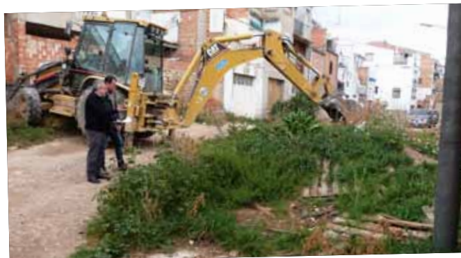
Actuació per reobrir al trànsit tot el carrer Ave Maria