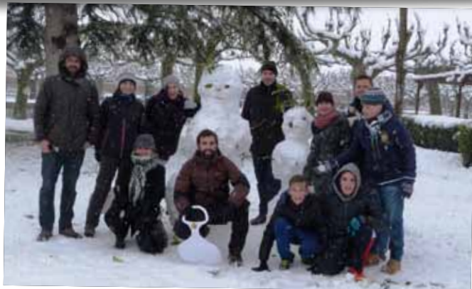
Aprofitant la nevada, varen fer ninots de neu al Parc del Terrall