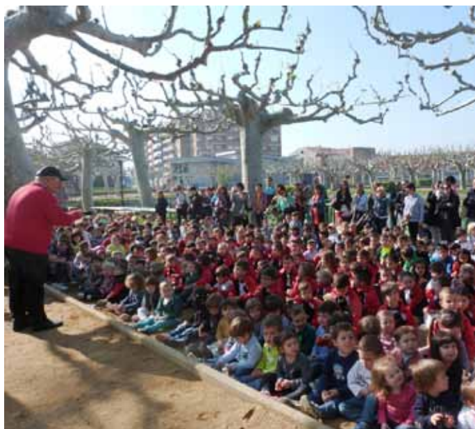
■ Inauguració del nou parc infantil al Terrall deïcat al conte del Patufet