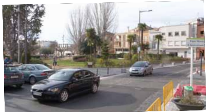
Repensem les Borges al servei de les persones. Conversió de l'antiga N-240 en via urbana (02-01-2014)