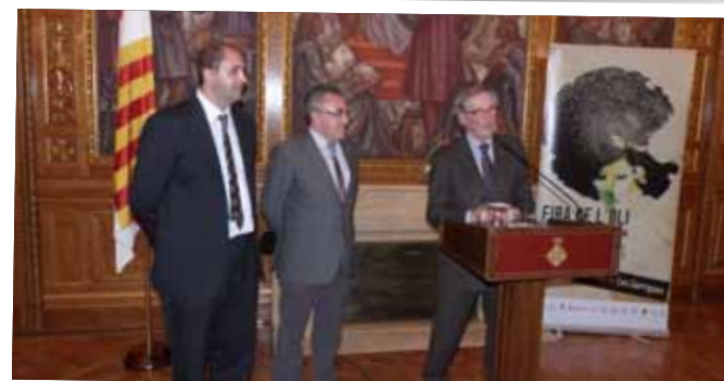
La Fira de l'Oli, el nostre millor aparador. L'alcalde de Barcelona, Xavier Trias, promociona els nostres productes (12-01-2013)