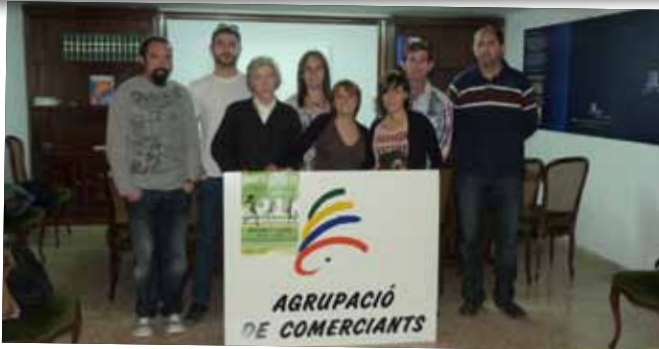
Impulsem el teixit comercial local. Col·laboració plena amb l'Agrupació de Comerciants de les Borges (02-05-2012)