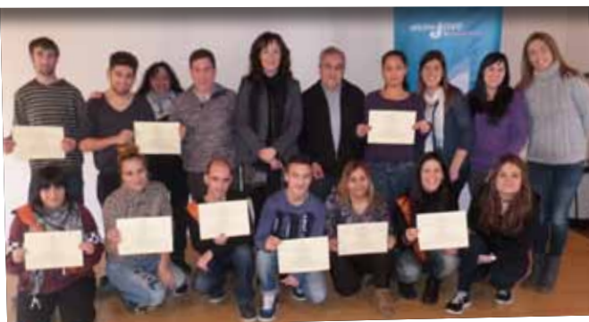
Diplomes per als participants del programa Fòrmula Jove