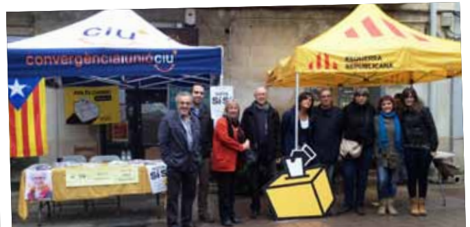
Les Borges al costat del procés d'independència de Catalunya. Campanya conjunta de CiU i ERC pel 9N al Mercat de es Borges (04-11-2014)