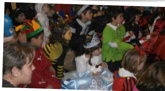
Carnestoltes infantil 2015 a les Borges Blanques