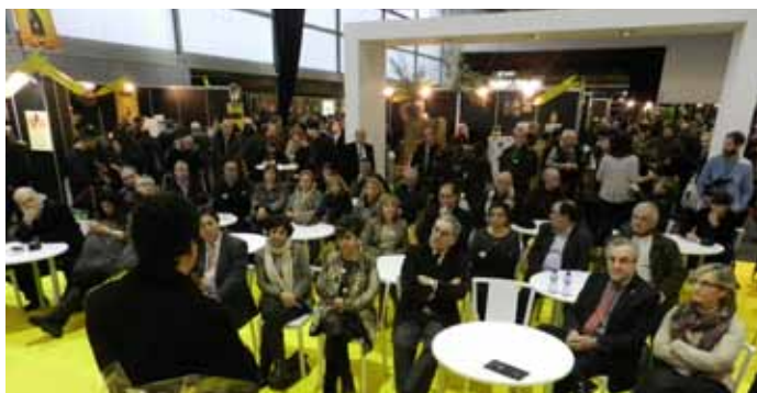
■ Agermanament amb la Ruta del Vi Costers del Segre a la 51a edició (2014)