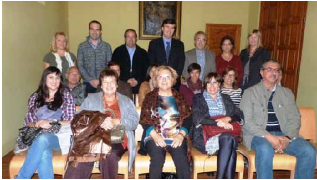
■ Entitats i representants institucionals a la signatura del Pla Educatiu d'Entorn de les Borges

Una altra bona part dels esforços de la regidoria durant aquests 4 anys han anat destinats a augmentar tot el possible la transparència de les actuacions municipals, aprofitant les possibilitats que avui ofereixen les noves tecnologies i millorant-ne d'altres com aquest mateix Butlletí d'Informació Municipal de les Borges. En aquest