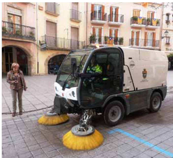
■ Presentació del nou vehicle per netejar els carrers de les Borges

a través de campanyes de sensibilització i noves ordenances de civisme per als propietaris de gossos, l'estrena del servei de recollida d'animals abandonats, fomentant la identificació electrònica amb xips, així com accions de col·laboració ciutadana amb les protectoras per ajudar a millorar l'atenció i la convivència amb els animals a les Borges.