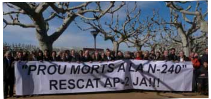
Lluitem per defensar els interessos del Territori. Gran acte a les Borges per exigir Prou morts a la N-240 (17-02-2014)