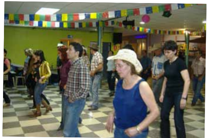
2008 FESTES COUNTRY