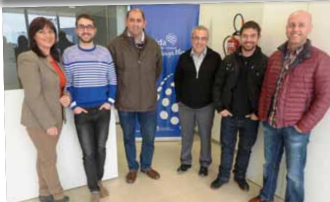
Benvinguda a noves empreses del CEI de les Borges