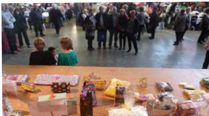
18a TRobada de puntaires de les Borges Blanques