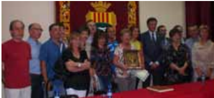
■ Colla Brut Nature