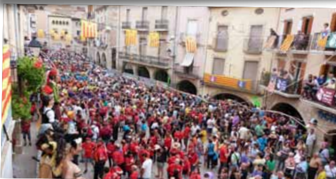
Som referent de la Cultura Popular. La Trobada de Gegants de les Borges cada vegada més participada (06-09-2014)