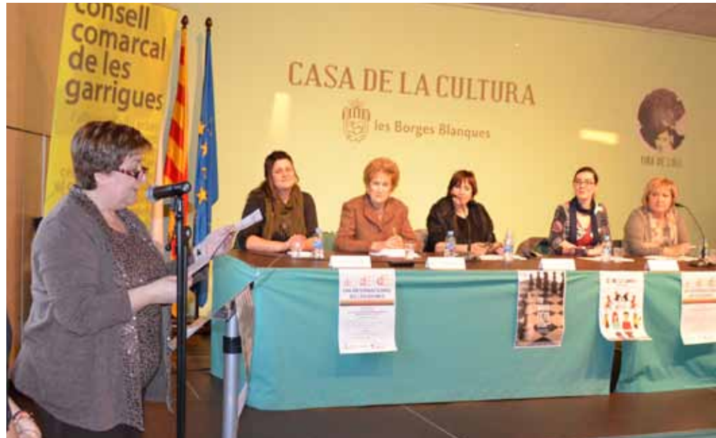
■ Celebració del Dia Internacional de les Dones a la Casa de la Cultura de les Borges

Així mateix, s'incorpora una màquina compactadora per als treballs del dipòsit controlat, sistema de GPS i pesatge a tots els vehicles i sistema de seguiment de les rutes. A més, estarà disponible un programa de control i seguiment d'incidències i s'instal·laran dues estacions meteorològiques amb detector de fuga de lixivats, consultable via web. Per a campanyes de