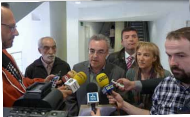
Fem respectar la qualitat del nostre Medi Ambient. Denúncia a Fiscalia contra General d'Olis i Derivats (15-04-2013)