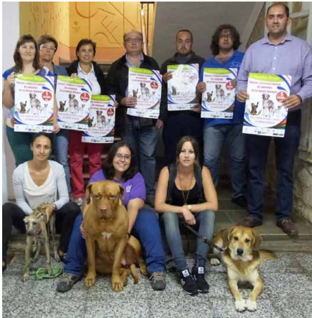
■ Presentació de la II Fira Mascotes Borges

Recolzar el teixit comercial de les Borges ha estat una altra de les prioritats durant aquest mandat, i per això, a banda de les accions de millora del centre comercial de la ciutat com l'arranjament del Raval del Carne, o el carrer la Bassa; o de les actuacions per promoure la reobertura dels locals comercials buits, entre d'altres actuacions de formació especialitzada, hem ofert tota la col·laboració municipal possible a l'Agrupació de Comerciants de les Borges.