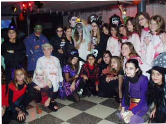
2012 CASTANYADA HALLOWEEN