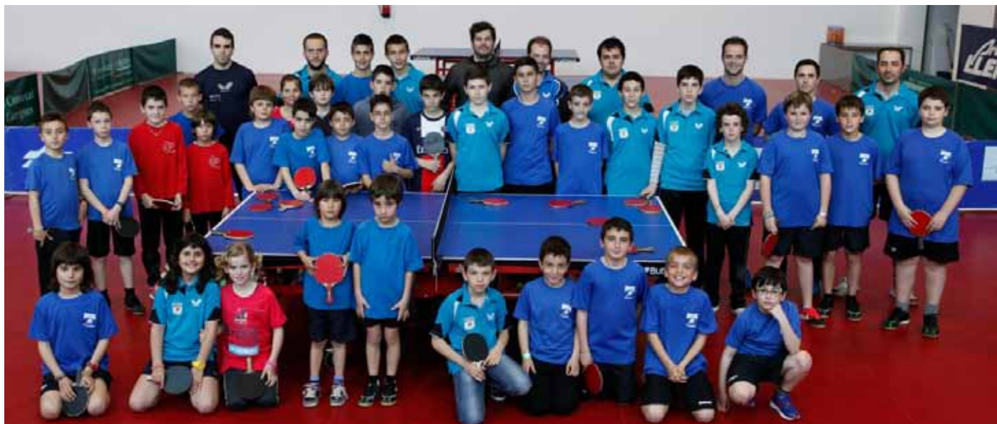
■ Primer entrenament dels equips de base del Club Tennis Taula Borges al nou Centre de Tecnificació

s'ha pogut millorar el paviment, estrènyer la calçada, eixamplar les voreres, substituir les canonades d'aigua potable i de la xarxa de clavegueram malmeses, plantar arbres, posar bancs i renovar la senyalització horitzontal i els semàfors al llarg de tres quilòmetres de l'arteria principal de la ciutat.