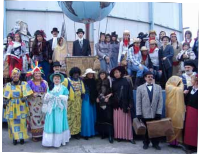
2007 CARROSSA LA VOLTA AL MÓN