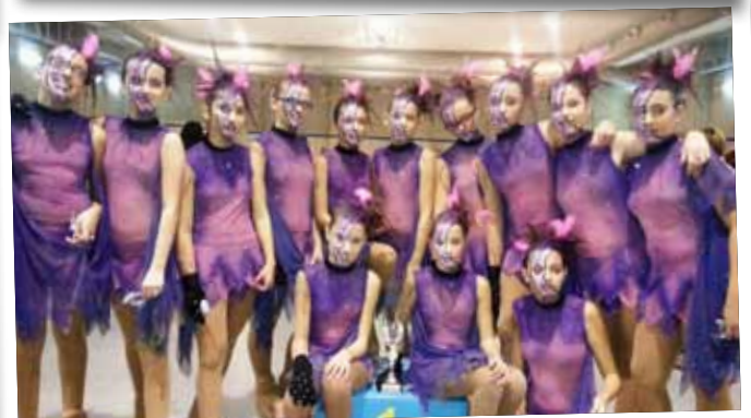
Les guanyadores del Campionat Provincial de Xous del Club Pati Borges