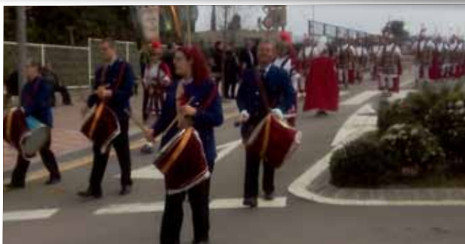
Trobada d'Armats 2015 a la Pobra de Mafumet