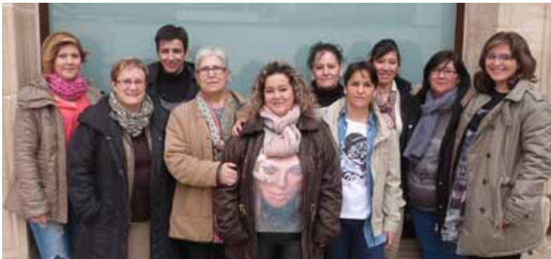
■ Servei de neteja instal·lacions municipals

Elles són les encarregades de mantenir netes i en bon aspecte les instal·lacions i edificis de titularitat municipal de les Borges Blanques, entre els que trobem l'edifici civil més important del municipi, el Palau del Marquès d'Olivart, conegut per ser la seu de l'Ajuntament de la capital de les Garrigues.