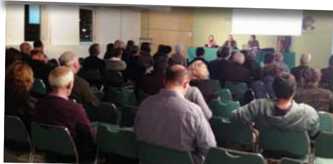
Xerrada informativa a les entitats sobre l'Impost de Societats