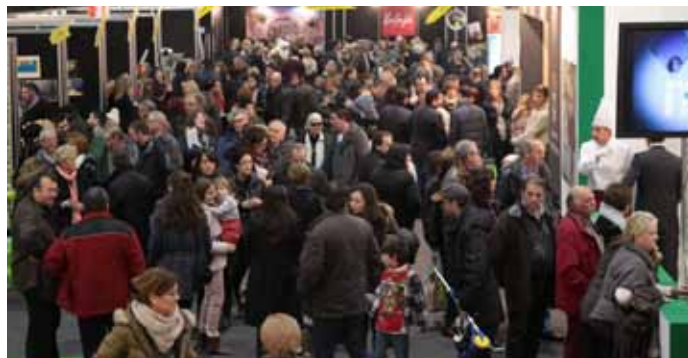
■ El públic que va omplir la 52a Fira de l'Oli i les Garrigues (2015)