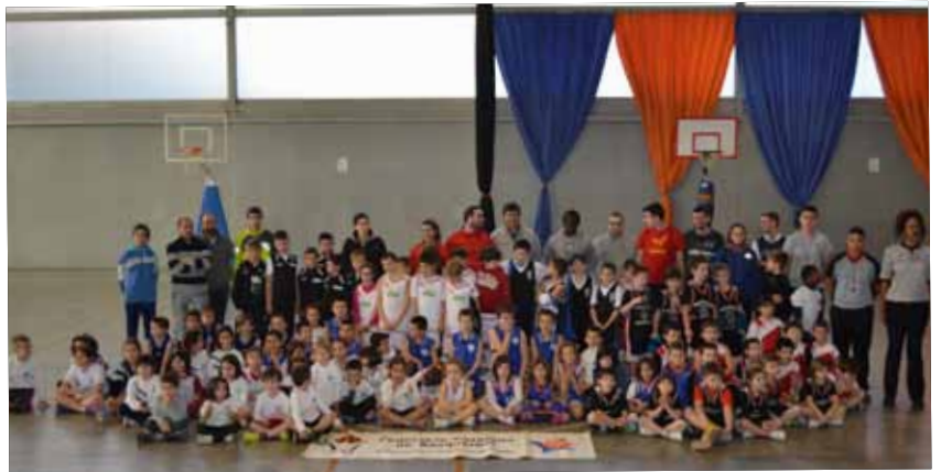
Trobada d'Escoles de Bàsquet a les Borges Blanques