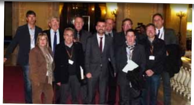
La Plataforma N-240 es reuneix amb el conseller Santi Vila al Parlament