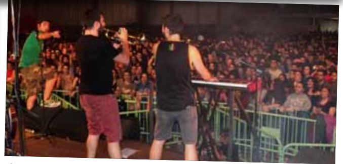
Concert de celebració del 25è aniversari de l'Esplai Apassomi