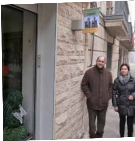
Banderes identificatives per als comerços locals (05-01-2015)